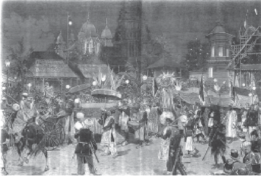
Figure 1. Cortège colonial lors d'une fête de nuit sur l'Esplanade des Invalides. L'Exposition de Paris 41 : planche hors-texte.

discours colonial républicain. Ces différents dispositifs ont la particularité de proposer des modes dynamiques de contacts interculturels entre les métropolitains et les gens des colonies, contrastant avec le caractère statique d'une exposition muséale, qu'elle soit de nature ethnographique ou commerciale.