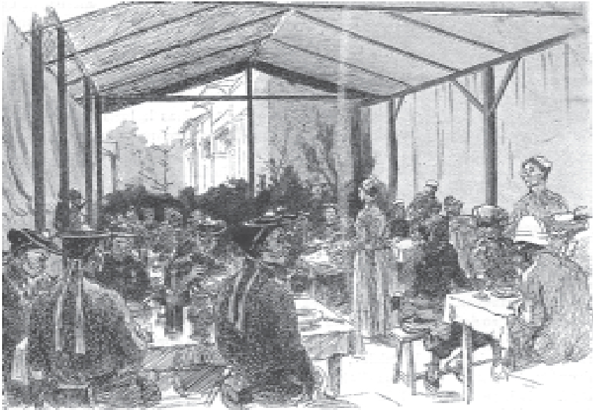
Figure 5. Les soldats coloniaux de diverses provenances attablés sous la tente des Fourneaux économiques. Revue de l'Exposition universelle 1(15) : 45.

économiques en vient à symboliser l'union des différents peuples de la France coloniale autour du flambeau républicain. À l'inverse, les visiteurs parisiens, préfigurant en quelque sorte les actuels clients de restaurants exotiques qui recherchent un succédané de voyage à travers la nourriture (Bell et Valentine 1997 ; Cook et Crang 1996), participent également à ce processus d'intégration en incorporant physiquement le monde colonial, répondant de cette manière au désir des organisateurs de faire prendre conscience au public français de l'étendue de son empire. Ces dispositifs de contact interculturels font ainsi le pont entre la culture coloniale et la culture populaire parisienne de la fin du XIX e siècle : dans le contexte de l'émergence d'une consommation de masse dans le Paris de l'époque (Williams 1982 : 61-64), l'exotique est mis en marché dans sa nourriture en même temps qu'il achète et ingère son appartenance à l'empire français.