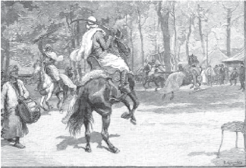
Figure 2. Les cavaliers de la Fantasia arabe dans l'arrière-cour du Palais Tunisien. Revue de l'Exposition universelle 1 (6) : 169.

Bien que ces deux appréciations divergent qualitativement, il nous apparaît que le cœur du discours reste néanmoins le même, appuyé sur l'évaluation du pittoresque et de l'authenticité de la représentation. Si, d'un côté, le manque de réalisme est déploré, alors que de l'autre, le charme semble avoir fait effet, dans chacun des cas, le visiteur embrasse pleinement son rôle de spectateur qui ne traverse pas une zone opaque d'altérité restant à être explorée, mais un théâtre colonial qui maintient une distinction de statut entre le public et les acteurs. Sa raison d'être est précisément de représenter la culture des colonisés, c'est-à-dire d'en présenter certains éléments sélectionnés replacés dans un contexte d'exhibition soumis ici à la rationalité de la mission civilisatrice républicaine. Le contact interculturel prend ainsi la forme d'un étonnement balisé à partir duquel les visiteurs peuvent appréhender, puis s'approprier, la culture d'un Autre distillé dont « l'étrangeté » est transformée en « curiosité ».