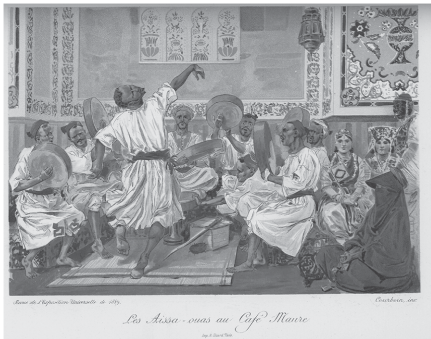
Figure 4. Spectacles des Aïssaouas. Revue de l'Exposition universelle , 1(10) : 304 ter.

Ces développements appellent donc des négociations ou des agencements identitaires qui ne s'inscrivent pas toujours directement dans un idéal type de la rationalité coloniale républicaine. Ainsi, la Fantasia arabe, le Théâtre annamite ou les Aïssaouas ne sont pas tant présentés à l'Exposition coloniale pour convertir l'opinion publique au bien-fondé de l'expansion coloniale et de la mission civilisatrice, mais plutôt pour attirer une masse de citoyens en quête d'exotisme. L'imagerie coloniale bénéficie d'ailleurs à l'époque d'une diffusion à grande échelle par le biais des réclames de produits exotiques, rhum, café ou dattes (Archer-Straw 2000 : 23-49). Il nous semblerait donc pertinent d'associer ces différents spectacles présentés à l'Exposition coloniale aux nombreuses autres manifestations culturelles qui émergent avec le développement d'une protosociété de consommation dans le Paris des dernières années du XIX e siècle, des music-halls au musée Grévin, des cafés-concerts au cinéma naissant. L'historienne américaine Vanessa Schwartz décrit très bien l'émergence de ce phénomène qui institue un nouveau rapport à l'expérience urbaine : « life in Paris became so powerfully identified with spectacle that reality seemed to be experienced as a show — an object to be looked at rather than experienced