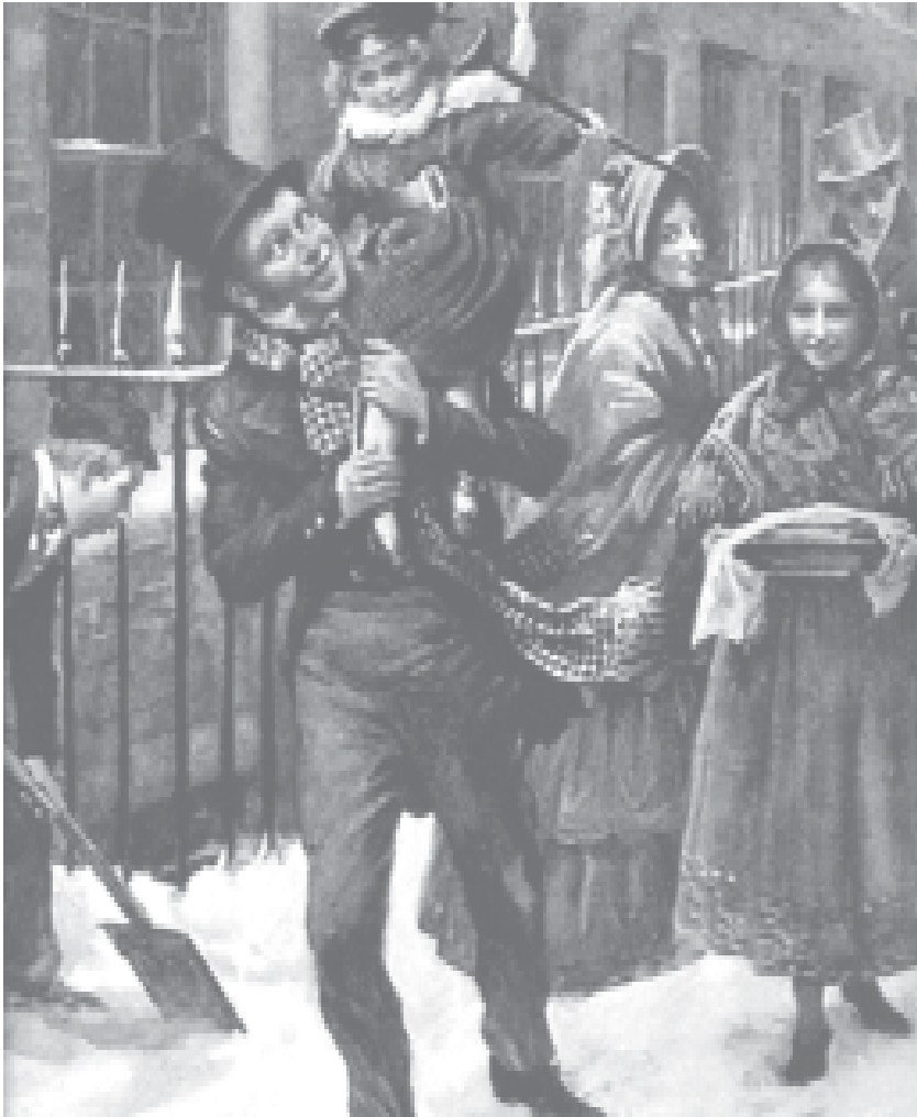
Figure 1. Tim Cratchit sur l'épaule de son père. Illustration de Hazel Frazee pour Un conte de Noël de Charles Dickens.