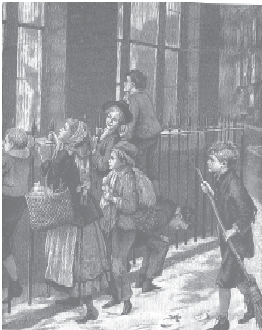
Figure 2. Les « sans famille » un soir de Noël à Londres. Gravure d'A.E. Mulready pour l' Illustrated London News, 25 décembre 1885.