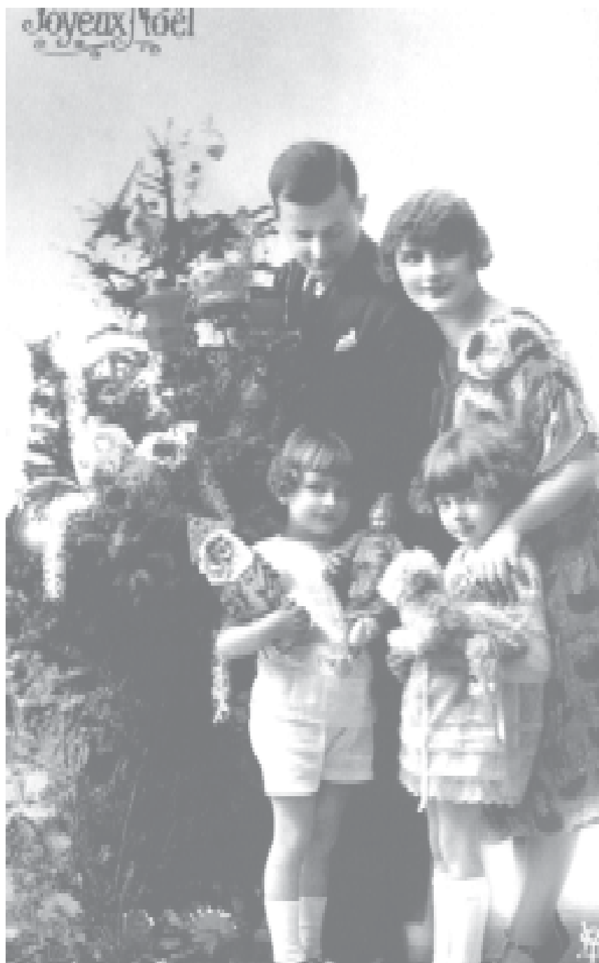
Figure 4. Carte de vœux. France, 1925.