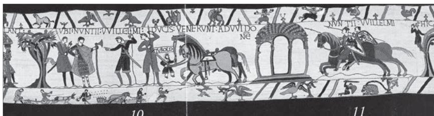
Fig. 1 : Broderie, scènes 10-11. Les messagers du duc chevauchent de droite à gauche ( Ubi nuntii Willelmi ducis venerunt ad Willmo ). Bordure : la fable du paysan qui sème du lin pour faire une fronde afin de chasser les oiseaux.