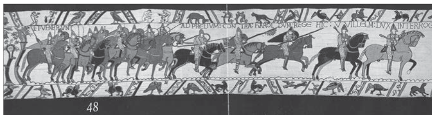
Fig. 3 : Broderie, scènes 48-49. Les cavaliers passent du pas au galop ( Et venerunt ad prelium contra Haroldum rege(m). Hic William dux interogat ).