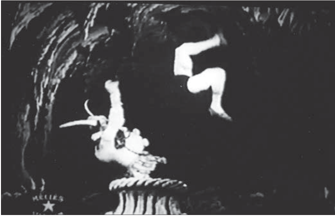
Fig.3: Georges Méliès, Le cake-walk infernal , 1903, collection de l'auteur.

épilepsie, contagion. On retrouve aussi des minstrels noirs donnant un numéro de claquettes dans un autre film de Méliès: Les échappés de Charenton, ou l'omnibus des toqués (1901). L'intérêt de cette œuvre n'est pas marginal pour notre propos, car ici la frénésie de leurs mouvements change les minstrels noirs en clowns blancs, qui redeviennent noirs, et ainsi de suite. Ils finissent par éclater en petits morceaux.