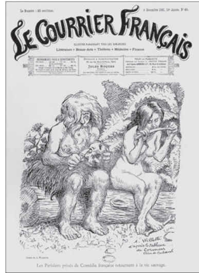
Fig. 7: « Les Parisiens, privés de la Comédie française retournent à la vie sauvage », par Willette, avec la gracieuse permission de la Bibliothèque Forney, Paris.

Naturellement, on craint que cette danse qui brouille les frontières entre Noirs et Blancs n'en vienne, en fin de compte, à détruire ces distinctions. Résultat: tout le monde deviendra sauvage. Or, dans cet interstice entre civilisation et sauvagerie, niche une autre spécificité française. Paris est connu pour l'indécence du cancan, ses revues de danseuses quasiment nues et ses cartes postales pornographiques. En effet, les Français sont perçus par leurs voisins européens comme licencieux, voire comme des obsédés sexuels: ils sont déjà exotiques! Cet étalage des instincts est représenté en 1899 dans un dessin de Willette (Fig. 6). La situation est encore plus dramatique dans ce dessin de 1901: un couple, assis dans une forêt, hirsute et nu, est en train de ronger des os et un crâne humain. Ils sont même devenus cannibales! La raison de cette déchéance se trouve dans la légende: « Les Parisiens privés de la Comédie française retournent à la vie sauvage. » Il suffit de peu de chose: enlevez le vernis de la grande culture, et les Parisiens régresseront à la sauvagerie de l'époque préhistorique (Fig. 7).