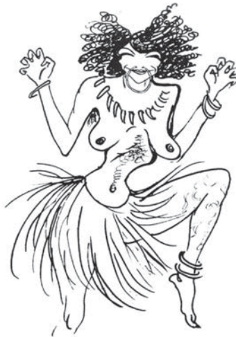
Fig.4: Polaire par Sem, avec la gracieuse permission de la Bibliothèque Forney, Paris.

41. Voir le dessin de Lucien Métivet sur la couverture du Rire du 23 janvier 1897, intitulé « Civilisation ! » : un Africain en costume tribal porte « des plumes, des verroteries, des étoffes à fleurs barbares, et des peaux de bêtes », explique la légende. Il est juxtaposé à une Parisienne élégante qui porte... « des plumes, des verroteries, des étoffes à fleurs barbares, et des peaux de bêtes ».