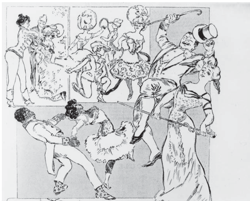
Fig.2: Le cake-walk à l'Olympia par Widhopff, avec la gracieuse permission de la Bibliothèque Forney, Paris.

Fougère, ou encore Polaire 29 . Cette dynamique est renforcée par les variations acrobatiques des artistes blanches, qui rendent la danse plus « épileptique », et qui sont parfois grimées en black-face comme cette danseuse à l'Olympia en 1903 (Fig. 2). C'est ainsi que les artistes blanches ont pu voler la vedette aux danseurs noirs. Les syncopes de la crise hystéro-épileptique se métamorphosent en secousses rythmiques irrégulières de musique syncopée 30 .