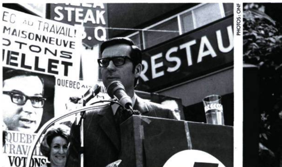
Québec: Duplessis et après... «Arcand compare les discours des candidats à l'élection de 1970 avec ceux de Maurice Duplessis, pour constater que malgré la Révolution tranquille, la politique n'a pas tellement évolué au Québec»

Un dossier sur Denys Arcand exige qu'on souligne la cohérence de son œuvre. Et si tous reconnaissent l'importance de ses trois films d'intervention, personne n'ose se compromettre et risquer de répéter des évidences. Pourtant il faut rappeler la démarche du cinéaste dans ses longs métrages documentaires. Non pas pour en faire une nouvelle lecture mais simplement pour vérifier que le talent d'Arcand est à la mesure de son engagement... et aussi pour dégager une hypothèse provisoire.