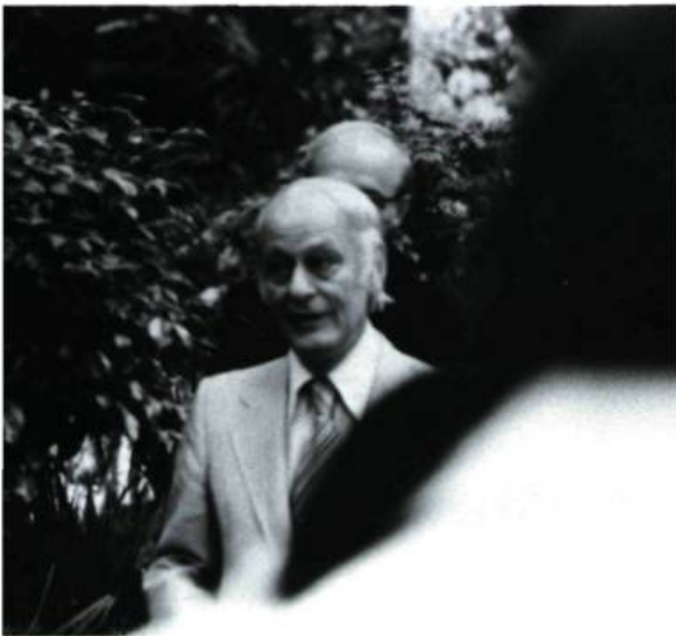
«Avec Le confort et l'indifférence la thèse est simple. Le débat entre le OUI et le NON était faussé à l'avance par le confort évoqué dans le dernier quart du film»