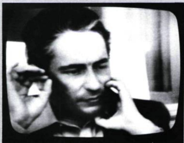
Visages d'Hubert Aquin (1975)