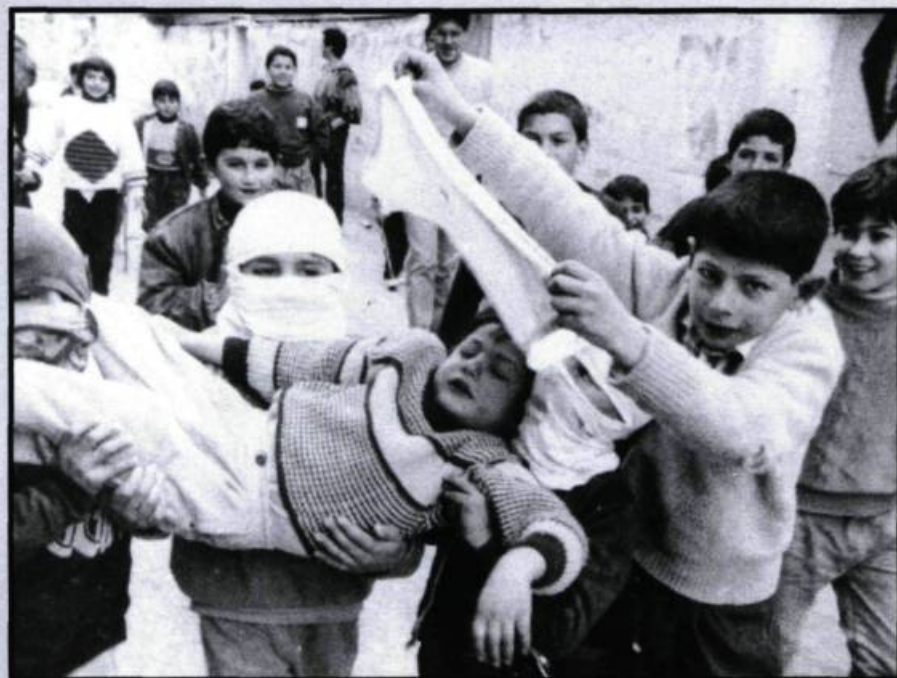
Les enfants du feu : quand le jeu et la réalité ne font qu'un.

loureuse faite de manifestations, de combats, d'arrestations, d'humiliations, de luttes quotidiennes pour la survie dans un monde sans hommes, au sein duquel la femme palestinienne amorce la lente conquête de son autonomie. Même souci éthique dans l'approche du réel pour Beyrouth, génération de la guerre 3 : six mois de recherches avant de trouver un échantillonage suffisamment représentatif de la jeunesse beyrouthine, plusieurs mois d'âpres discussions pour créer un lien privilégié avec une génération sacrifiée, privée de son enfance, dans l'enfer d'une guerre qui ne laisse dans son sillage que ruines, désolation et espoirs déçus. Parallèlement à la radioscopie de cette jeunesse marginalisée et sans avenir, le cinéma de Masri et de Chamoun se veut «instrument d'analyse et de communication». Il entreprend de remonter aux origines du conflit, évoque l'éveil des consciences politiques palestinienne et libanaise, narre le temps des désillusions et, en dépit de tout, caresse encore le rêve d'une société plus égalitaire et le fol espoir d'une paix qui fera taire à jamais la fureur des sectarismes et l'arrogance des prétendants extérieurs. Avec Les enfants du feu 4 , Mai Masri pousse en quelque sorte plus loin cette plongée dans un réel douloureux, puisqu'il s'agit dans son cas d'un véritable retour aux sources. Quatorze ans après avoir quitté sa ville natale de Naplouse, la cinéaste revient en Cisjor-