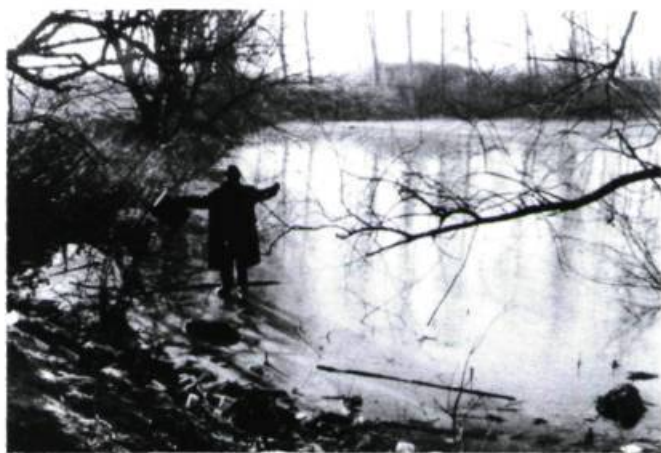
Allemagne neuf zéro

Si Godard mène en permanence un combat avec la forme, il mène aussi un combat contre la société des mass-médias, la société de consommation; celle de l'organisation technico-économique (ce qui s'exprime entre autres par cette quête d'une virginité de la perception présente dans son cinéma depuis le début des années 80). Ce combat se trouve représenté, dans Allemagne neuf zéro (mais aussi dans Histoire(s)... ), par l'image de saint Georges et le dragon (le chevalier à la lance sur un cheval) symbolisant la lutte contre le mal. Les dragons prennent ici la forme d'immenses engins métalliques grugeant la terre et incarnant cette idée de puissance qui sous-tend le désir d'expansion de notre monde industrialisé. Chemins qui ne mènent nulle part nous dit alors un