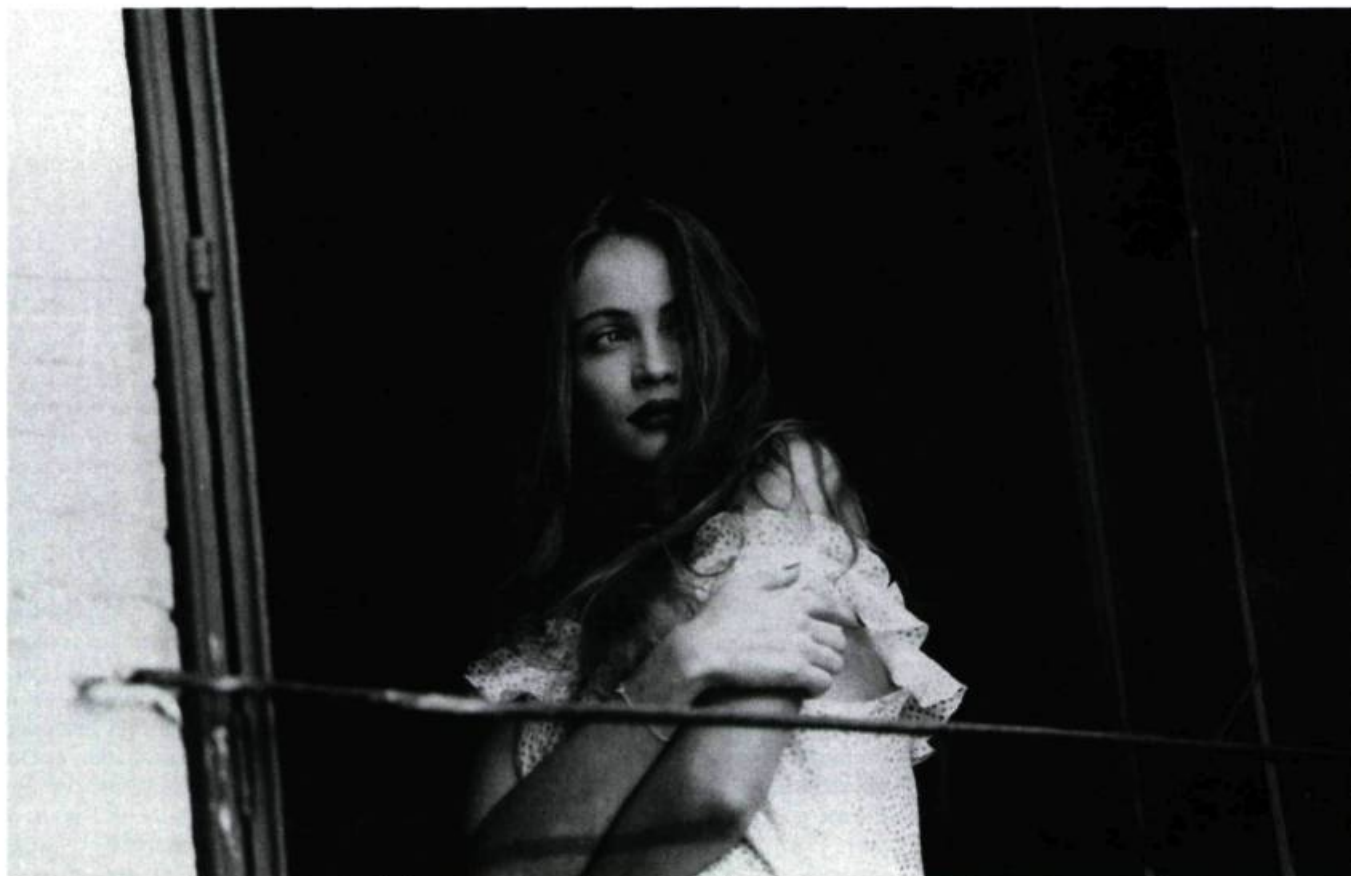
Nelly fantasmée: «L'insolence que Paul s' imagine contraint à subir».

apparaissent nettement comme le signe de l'insolence que Paul s' imagine contraint à subir. C'est cette même tension que l'on retrouve aussi dans la séquence de projection — qui marque par ailleurs l'engagement irrémédiable de la relation dans une impasse mortelle — où la lumière donne vie sur l'écran à des films de vacances que Paul, en proie à des hallucinations semblables aux calembours qui assiègent un esprit surmené, perçoit comme incriminants pour sa femme.