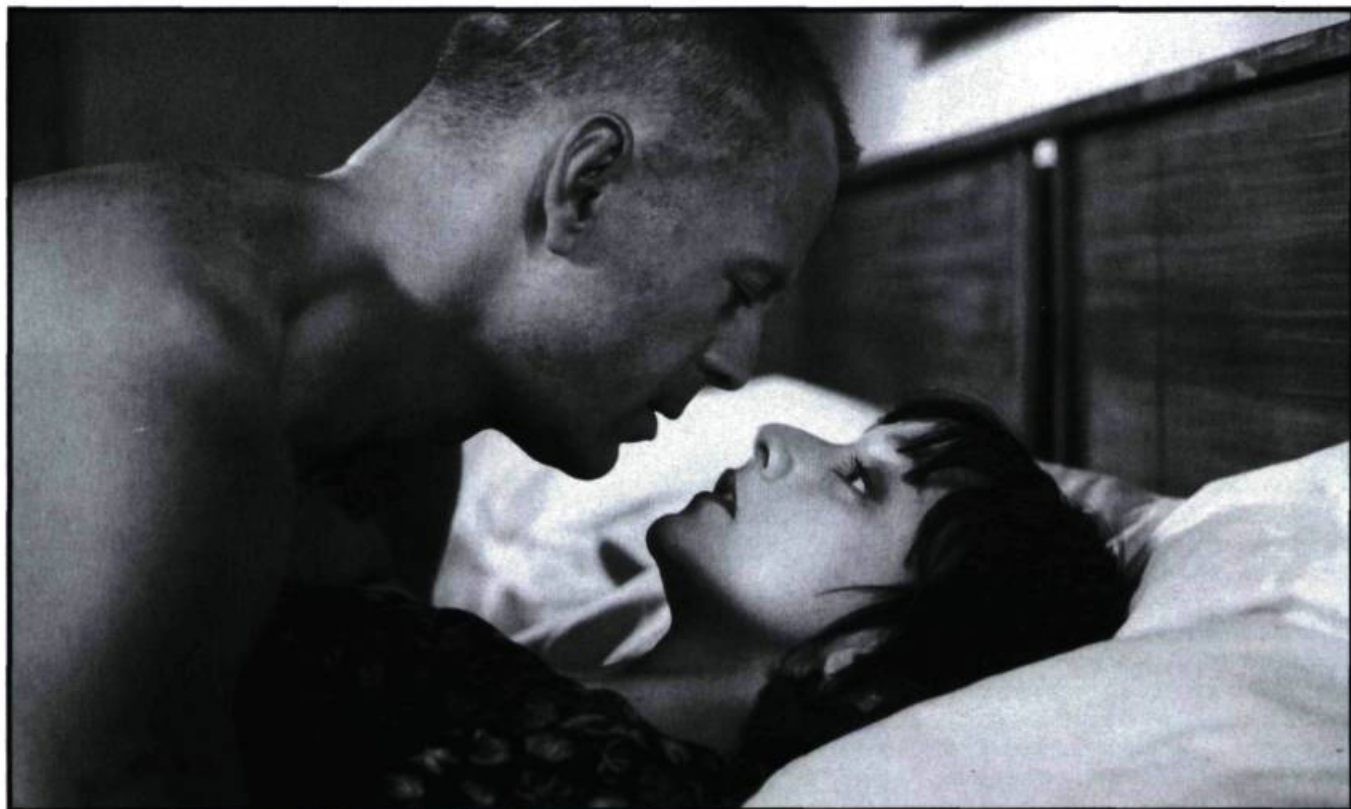
En haut; Bruce Willis et Maria de Medeiros.