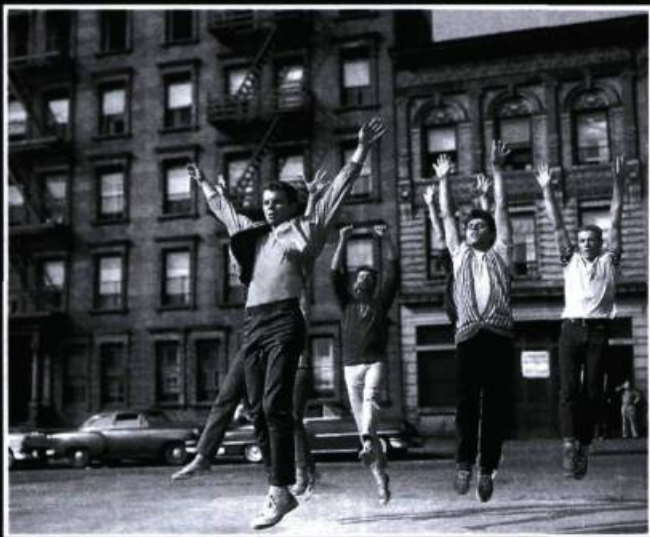
West Side Story: «Continuer de créer l'opéra américain contemporain par la musicalisation du socioculturel.»

Lester, formé dans le cinéma direct, la pub et la télé, inventa en quelque sorte la matrice d'un nouveau musical libre et goguenard, décontracté et lyrique, capable de s'alimenter à la seule