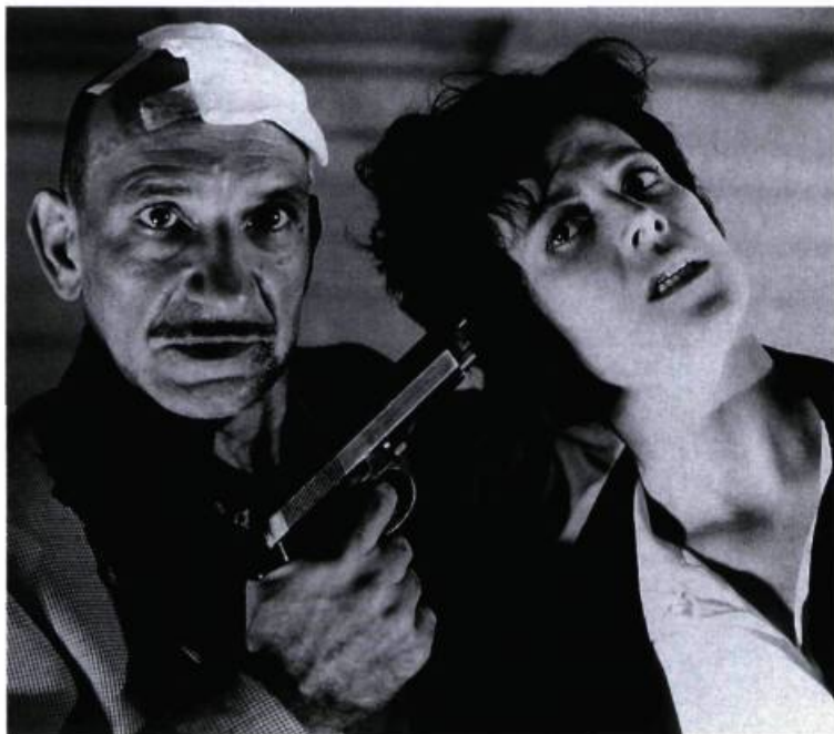
Ben Kingsley et Sigourney Weaver.

Votre pays a connu la dictature, vous étiez jeune et courageuse, vous étiez ce qu'on pourrait appeler une dissidente. Vous avez été arrêtée, mise au secret, torturée. Plusieurs années après, même si le régime politique a changé, vous vivez