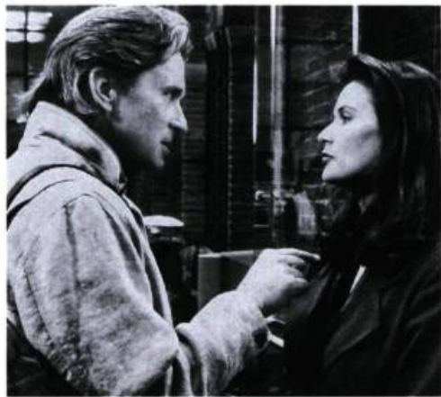
Michael Douglas et Demi Moore.

— connaîtra donc le calvaire qu'ont vécu plusieurs femmes, et le spectateur en retirera une leçon édifiante. Voilà qui est bien joli, mais pour embrouiller le discours, Levinson joue également la carte très tape-à-l'œil du sexe — « érotisme soft » serait plus juste — et le climax est atteint dans la fameuse scène de harcèlement qui fait courir les foules, un moment torride où Douglas se fait séduire par une Moore plus que provocante. On s'en doute, son épouse qui l'attend à la maison n'a pour elle que la terne stabilité d'une mère de famille. En d'autres mots: le harcèlement est une chose ignoble, mais bon Dieu que c'est excitant! Pour ajouter un peu de couleur à cette formule maintes fois éprouvée depuis Fatal Attraction , la mise en scène intègre de nombreux machins informatiques qui forment comme un immense show-case technologique. Se manifestent d'ailleurs à ce chapitre les principales préoccupations de Crichton chez qui la technologie, en ce cas-ci la réalité virtuelle, est toujours vue d'un œil soupçonneux. Cela nous vaut donc tout d'abord la présence d'une multitude d'ordinateurs hypersophistiqués reliés en réseaux qui permettent à