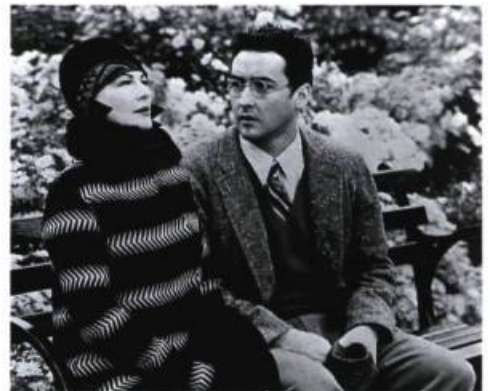
Dianne Wiest et John Cusack.

manque à ce film pour combler l'attente année après année par les livraisons de Woody Allen. Dès que celui-ci nous retire le plaisir de connaître la suite des affres existentialistes qui agitent son personnage/double, il nous frustre, il nous prive de nos repères. Le bel objet qu'il nous propose échappe à cette galaxie, le spectateur est ainsi comme «trompé par la marchandise». C'est le danger d'une œuvre (trop) homogène. Vivement donc l'année prochaine, en espérant que notre stakhanoviste préféré nous revienne plus inspiré. (É.-U. 1994. Ré.: Woody Allen. Int.: John Cusack, Dianne Wiest, Jack Warden, Chazz Palminteri, Joe Viterelli, Jennifer Tilly, Rob Reiner.) 99 min. Dist.: Alliance. — P.G.