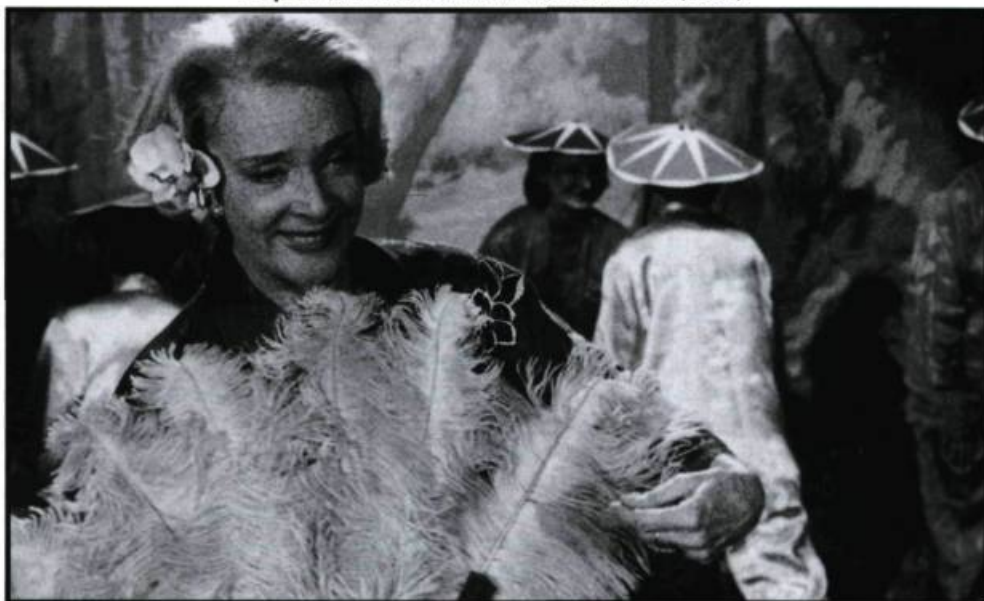
Le jour des rois de Marie-Claude Treilhou (1990).

Pensez-vous que les rôles sont plus variés aujourd'hui qu'à vos débuts? Je me souviens d'un entretien avec