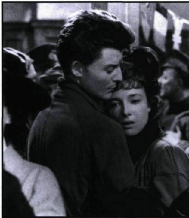
Gérard Philipe et Micheline Presle dans Le diable au corps de Claude Autant-Lara (1947).