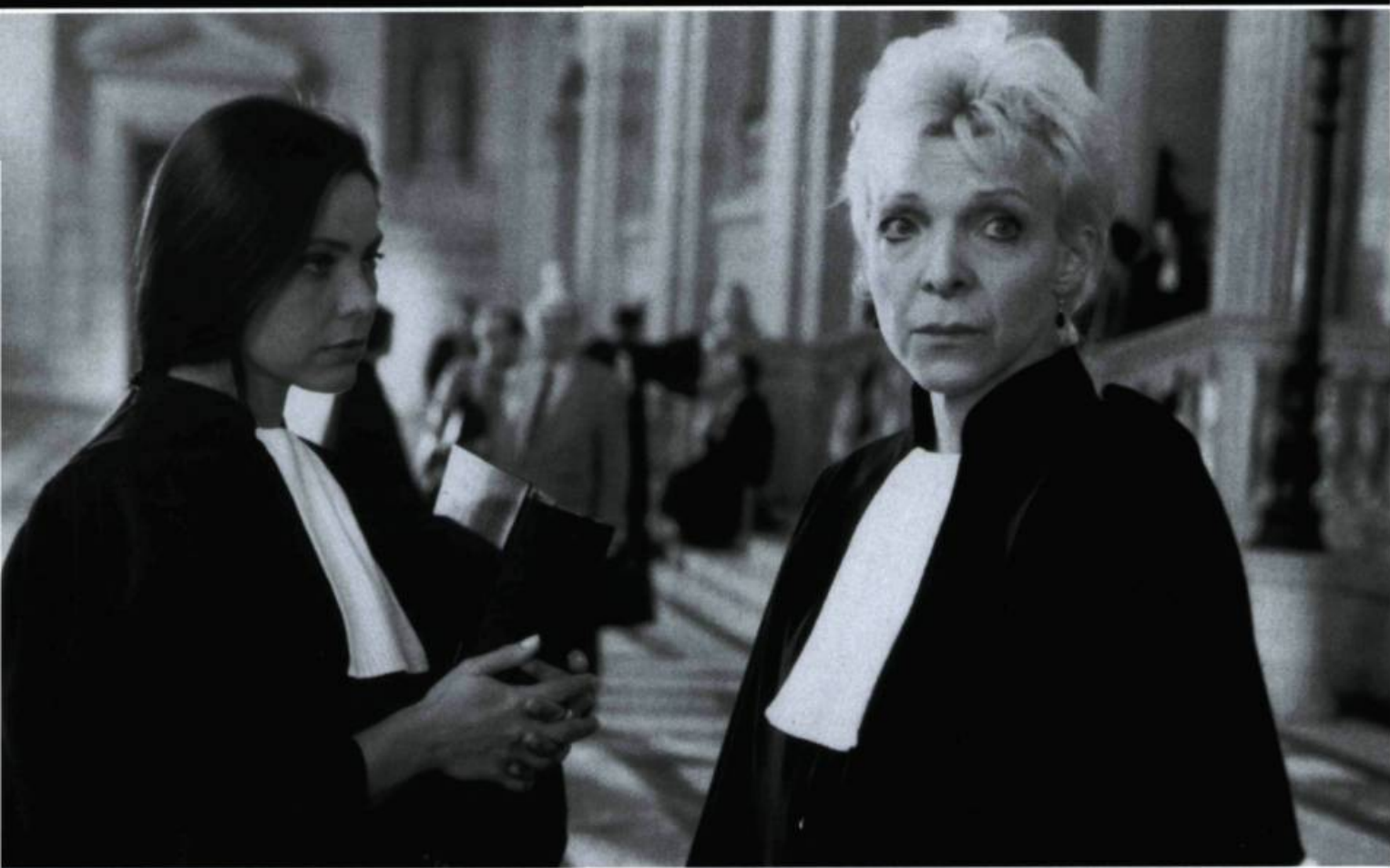
Ornella Muti et Tonie Marshall dans Pour rire! de Lucas Belvaux.