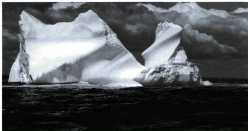
L'amour fusionnel: le feu, la glace.

Pour Anne Claire Poirier, le cinéma est affaire de morale. On se souviendra à cet égard de la discussion sur la représentation du viol autour de la table de montage dans Mourir à tue-tête . Comment montrer l'immontable sans sombrer dans la complaisance ou le voyeurisme? Cette question éthique revêt aujourd'hui une importance toute particulière dans Tu as crié: «Let me go» . Sans doute parce que le cinéma doit ici avant tout rendre compte d'une tragédie personnelle: la disparition d'une fille toxicomane, retrouvée morte assassinée. Tu as crié: «Let me go» sera donc l'anti- Christiane F. , et qui s'en plaindrait! Pour apprivoiser la perte de Yanne, «sa difficile», Anne Claire Poirier filme l'absence et le manque, en noir et blanc, la couleur de sa propre nuit intérieure. La caméra erre dans des couloirs vides, hante les lieux de l'obscurité (la ruelle du crime, la morgue, la salle du procès de l'assassin), glisse sur les murs craquelés d'un désarroi à vif qui voudrait bien «trouver un sens à ce qui n'en a pas, tenter de chasser le mal», même s'il s'agit là d'une entreprise quelque peu dérisoire dans sa lucidité même, la douleur ne s'effaçant jamais vraiment dans la réconciliation du deuil. Face à ce drame intime qui la mine, Anne Claire Poirier ne donne jamais à voir sa fille, ni son meurtrier, pas plus que le quotidien sordide de l'enfer de la drogue. Par choix. Au spectateur donc d'appréhender dans les jeunes toxicomanes que la cinéaste