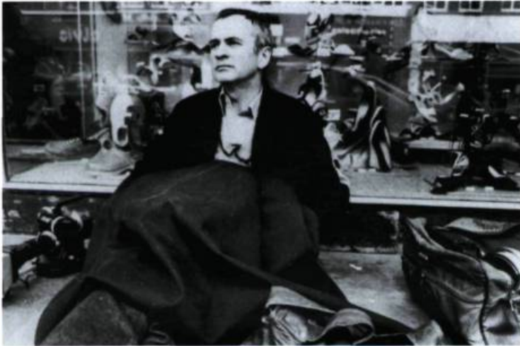
Johan van der Keuken sur le tournage.

Si le documentaire consiste à partager une expérience à la fois humaine et esthétique, rares sont les films qui, par la grâce et l'intelligence absolue du montage, parviennent à fondre les images en une entité organique et puissante, tout en s'aventurant sur les chemins buissonniers de la création dans une totale liberté d'improvisation. Coup de cœur! La Cinémathèque consacrait récemment une journée complète à Johan van der Keuken («l'ami de longue date») et présentait en avant-première Amsterdam, village global , une de ces œuvres-maîtresses qui «savent» encore (savoir-faire, au sens noble, artisanal) étreindre le réel et le monde sans jamais rien céder sur un évident plaisir de raconter et de filmer. Au centre d'un titre évocateur s'il en est: Amsterdam, ville-mosaïque riche de son passé et ouverte aujourd'hui à la multiplicité des cultures. Ville-creuset donnée à voir essentiellement à travers le regard de ses nouveaux arrivants (Marocains, Boliviens, Tchétchènes, Africains) qui sont venus fertiliser de leur identité le pays d'accueil tout en maintenant un pont avec leur terre d'origine. Amsterdam donc comme condensé de ce village global qu'est devenue la planète et dont la télévision, du haut de sa