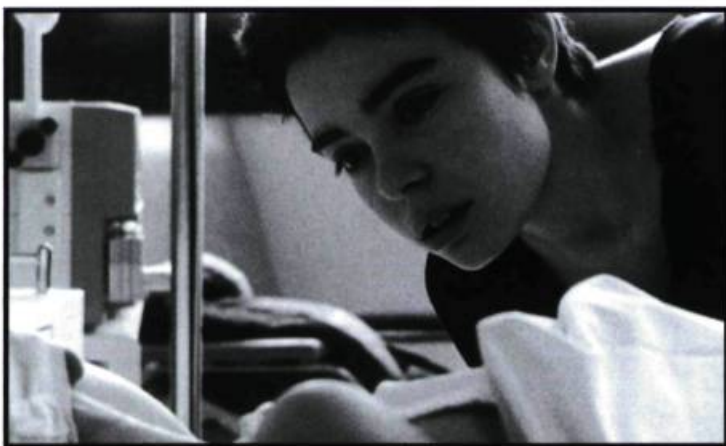
Le premier long métrage d'Érick Zonca, La vie rêvée des anges , une des plus belles surprises de la Compétition officielle.

là que d'une illusion propre au monde virtuel, compte tenu que plusieurs des films qui comptent cette année sont le fait de coproductions impliquant la France, c'est-à-dire l'un des rares pays, sinon le seul, qui peut encore opposer une certaine forme de résistance à l'homogénéisation de la culture qui, sous couvert d'universalité, sera américaine.