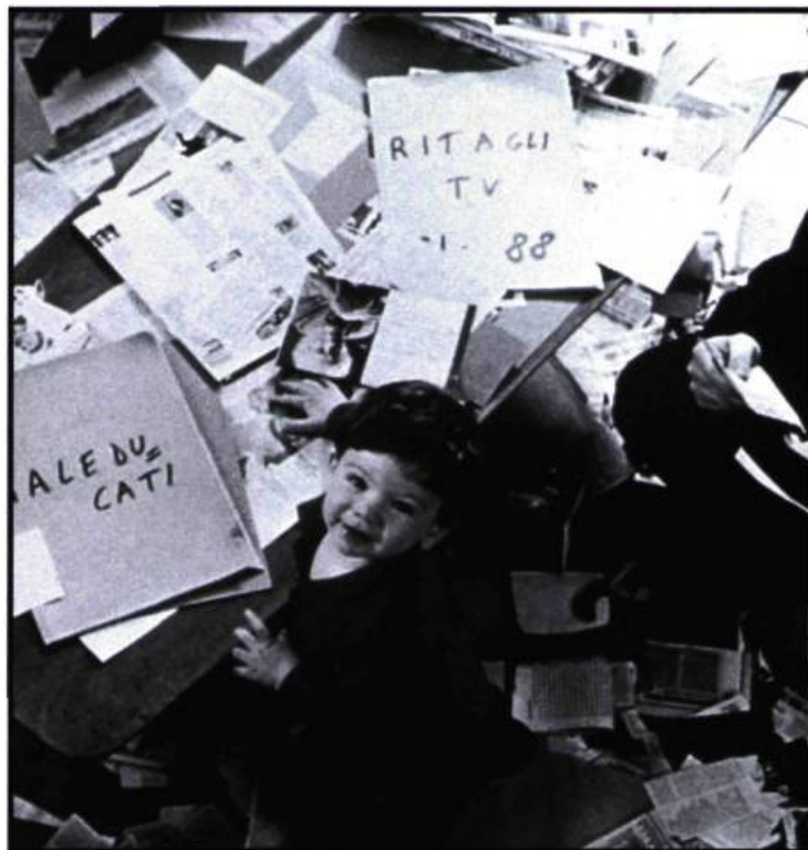
Aprile , un intermezzo qui n'a pourtant rien d'une œuvre mineure.

Tout d'abord, il a rajeuni son image en produisant un programme officiel moins prétentieux, de plus petit format, délesté de ses pages publicitaires snobs annonçant des produits inaccessibles pour le commun des mortels. Aussi, il conviendrait d'y grouper à part les films présentés hors compétition, qui composent un cocktail disparate, où Shohei Imamura ( Kanzo sensei ) et Manoel de Oliveira ( Inquiétude ) côtoient Alex Proyas et Roland Joffé, mais qui n'en constituent pas moins dans les faits une section au même titre que les films retenus pour Un certain regard. L'image de la Compétition officielle ne s'en porterait que mieux, et cette section Hors compétition se verrait contrainte de mieux définir ses objectifs. On a aussi revampé la Palme d'or, l'emblème du Festival, en changeant de designer et de commanditaire (ou de «sponsor», comme disent les Français dans leur français qui se veut «in»). Ainsi relooké et responsabilisé (vous me suivez?), et fort du «book papier» que le service de presse se targue de mettre à la disposition des journalistes, le Festival est fin prêt à entrer dans le prochain millénaire. Mais, au delà de cette opération cosmétique, il y a bien sûr le contenu, nettement plus important. Voyons de quoi il retourne.