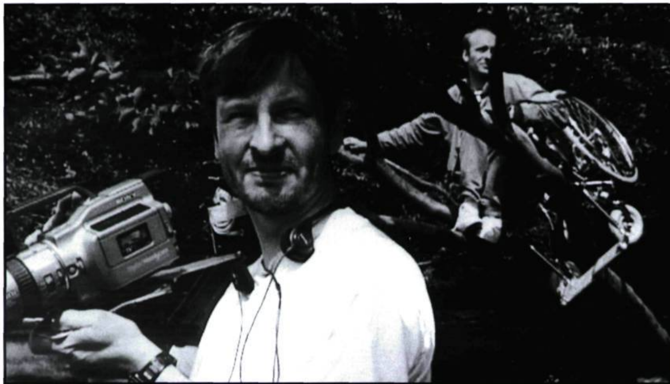
Lars von Trier sur le tournage des Idiots , un des deux films qui, tournés dans l'esprit du manifeste Dogme 95, sont venus secouer le cocotier d'un cinéma «international» académique.

montrant, dans Aprile , les rapports normaux d'un père avec son bébé. Des rapports qui l'amènent, bien évidemment, en tant que père à l'écran, à remettre en question à son tour les figures d'autorité de son propre pays. Bref, il s'agit d'une thématique incontournable que nous abordons en ces pages et dont on n'a pas fini d'entendre parler.