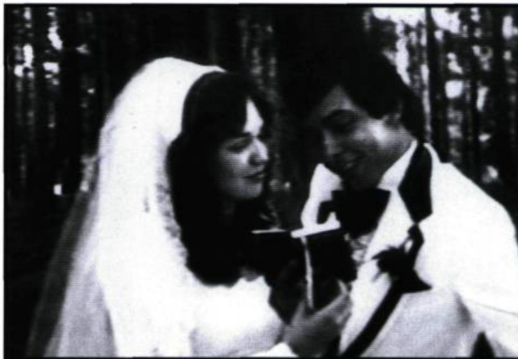
Le royaume est commencé.