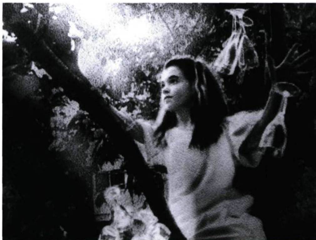
Une artiste (1994).