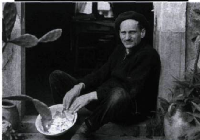
En haut: Georges Rousse, la lumière et la ruine. En bas: Gaston Chaissac, plante vivace.

l'inventivité, réelle et stimulante, des projets dont parfois ils se trouvent à témoigner. Voyez Daniel Libeskind: Welcome to the 21 st Century (pourtant produit par la BBC), dont le projet audacieux est épinglé comme «exemple d'architecture dominatrice», du fait qu'il jure singulièrement avec le reste du bâtiment du Victoria and Albert Museum à Londres auquel il s'accroche d'une façon arrogante et outrageante.