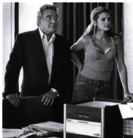
Albert Finney et Julia Roberts.

Un simple nom de famille en guise de titre. Comme la Norma Rae de Martin Ritt ou la (Karen) Silkwood de Mike Nichols, Erin Brockovich est une héroïne exemplaire qui va se dresser face au cynisme des puissants (ici, une compagnie polluante) pour faire triompher le droit des plus faibles (les habitants de la localité de Hinkley, en plein désert Mojave). Tiré d'une histoire vraie, le récit s'attache à la métamorphose d'une petite secrétaire flamboyante (mère célibataire de trois enfants, au franc-parler) en une farouche avocate, prête à tout sacrifier pour la bonne cause. Air connu donc et indignation assurée du spectateur qui ne peut qu'endosser cette cause et succomber au charme débordant d'une Julia Roberts au meilleur de sa forme depuis Pretty Woman et admirablement secondée par Albert Finney, en vieil avocat roublard au grand cœur. Véhicule taillé sur mesure pour une actrice déjà bien placée au box-office (elle est aujourd'hui la comédienne la mieux payée d'Hollywood grâce à ce rôle), Erin Brockovich ne serait qu'une habile comédie dramatique de plus, placée sous le signe de l'intimisme sociologique, sans la présence à la barre du réalisateur inspiré de The Limey . Évitant avec bonheur les pièges soporifiques du film à procès, Steven Soderbergh réussit à l'intérieur d'un genre extrêmement balisé à imposer timidement sa griffe. Mise en scène décalée à la fois sobre et élégante, raffinement de l'image, force interne des raccords sous-tendus par une