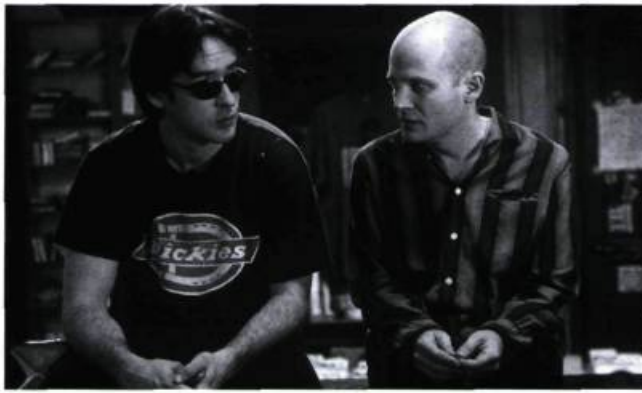
John Cusack à gauche.