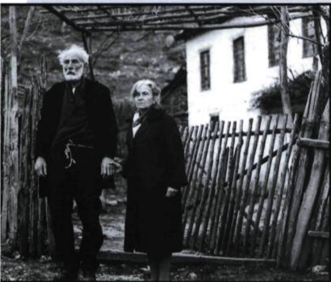
Le voyage à Cythère de Theo Angelopoulos.

Tout cinéphile a sans doute encore en mémoire la silhouette déchirante du vieux Spyros à son retour d'URSS dans Voyage à Cythère (Angelopoulos), symbole d'une génération perdue qui ne se reconnaît plus dans la Grèce des années 80, et qui finit abandonné par tous sur un radeau en marge des eaux territoriales de son pays. Comment oublier aussi les visages émouvants des immigrants d' America, America (Kazan) entassés à Ellis Island, au large de New York, dans l'attente arbitraire de leur statut? Le cinéma et l'exil ont toujours eu partie liée, comme l'attestent toutes ces figures flottantes sans ancrage, ces corps déplacés en suspens, se profilant dans l'aube blanche d'un avenir incertain. Un radeau, une île-«dépotoir»: deux no man's land... tel semble le lieu d'énonciation privilégié de l'exil.