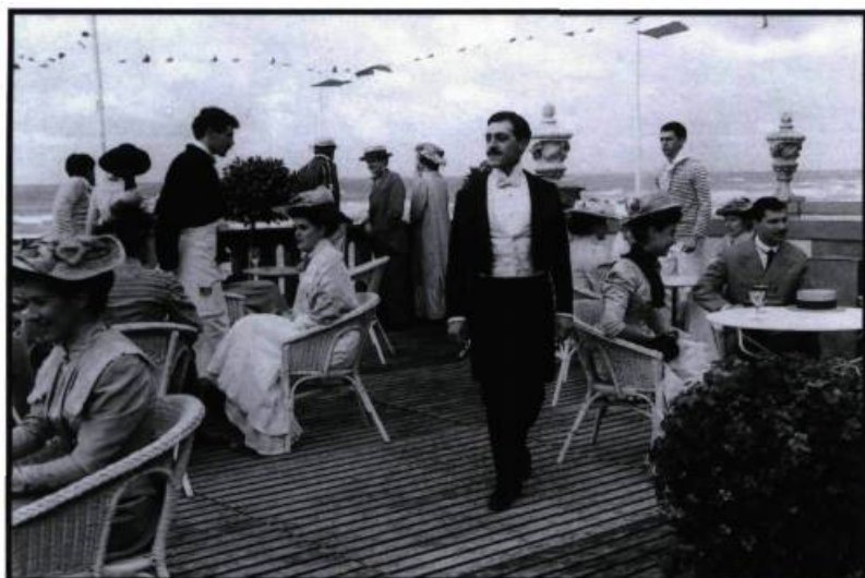
Le temps retrouvé. Les fictions éclatées, hétérogènes et hybrides de Raúl Ruiz contribuent à élaborer un nouvel espace imaginaire.