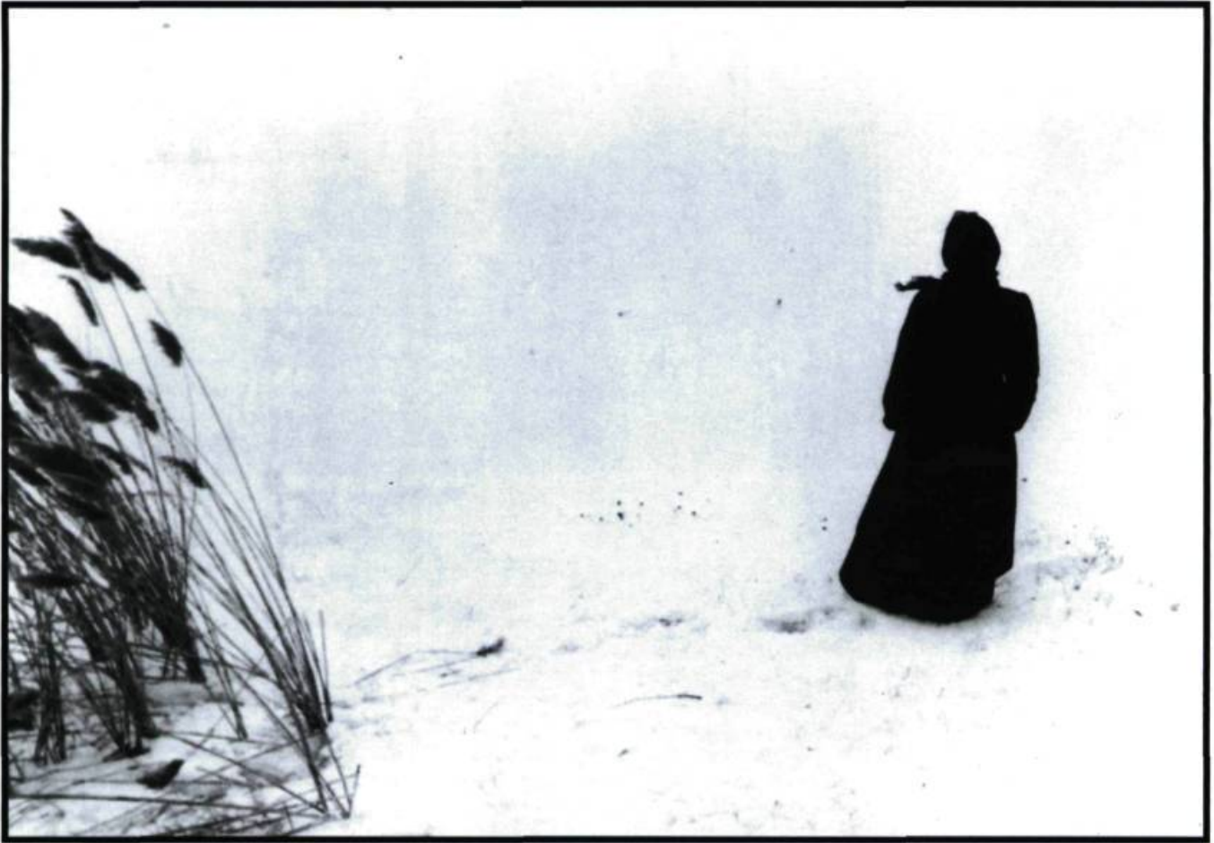
Prendre possession du cadre et du territoire. Le plan final de La sarrasine de Paul Tana.