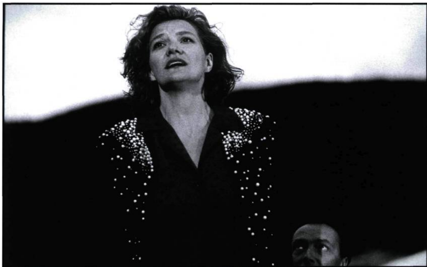
Cap Tourmente (1993) de Michel Langlois.

L'institution s'appelle l'École nationale de théâtre et c'est la formation pour le théâtre qui représente la base de l'enseignement qu'on y reçoit; ça reste le premier art, et l'épreuve suprême pour l'acteur. D'ailleurs, quand je reviens au théâtre après quelque temps passé à la télé ou au cinéma, c'est là que je mesure où j'en suis dans mon métier. Le vrai test est là. Par contre, les responsables des dif-