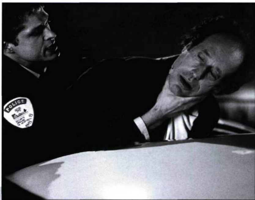
Post mortem (2000) de Louis Bélanger.

À l'étranger, on peut trouver plusieurs exemples d'échanges entre cinéma et théâtre. Il y a d'abord les réalisateurs qui sont également metteurs en scène au théâtre. Nommons Ingmar Bergman, Patrice Chéreau, Rainer Werner Fassbinder, Bob Fosse, Elia Kazan, David Mamet, Luchino Visconti, etc. Ici, le seul à faire le pont entre théâtre et cinéma est Robert Lepage, mais son approche qui repose largement sur le work in progress constitue un cas à part. Alors que ces