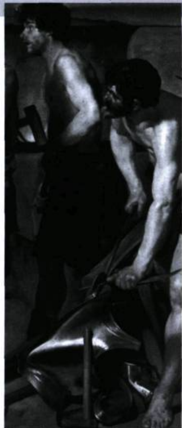
Les forges de Vulcain, Vélasquez, 1630.