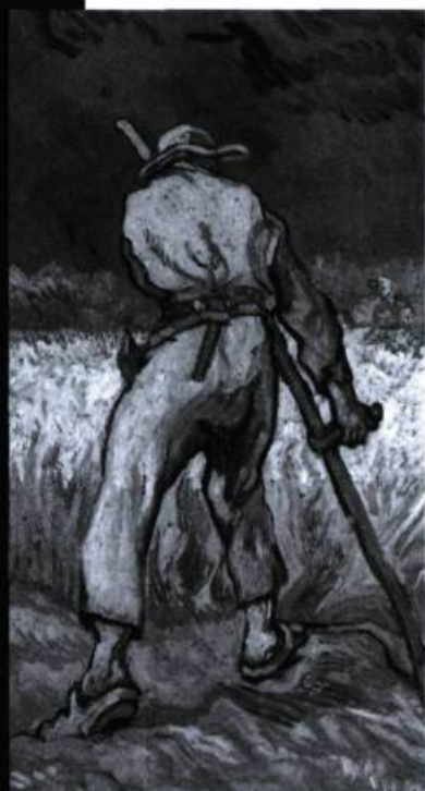
Le moissonneur, Van Gogh, 1889.