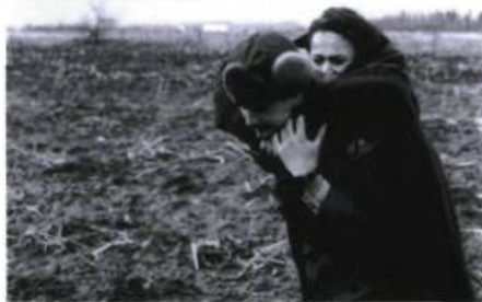
Le piège d'Issoudun.