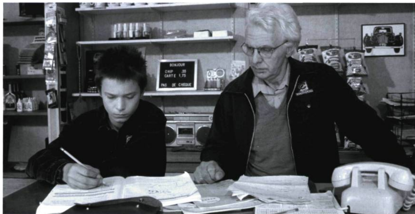
Gaz Bar blues , une représentation attentive et sensible de la vie d'un quartier de Montréal.