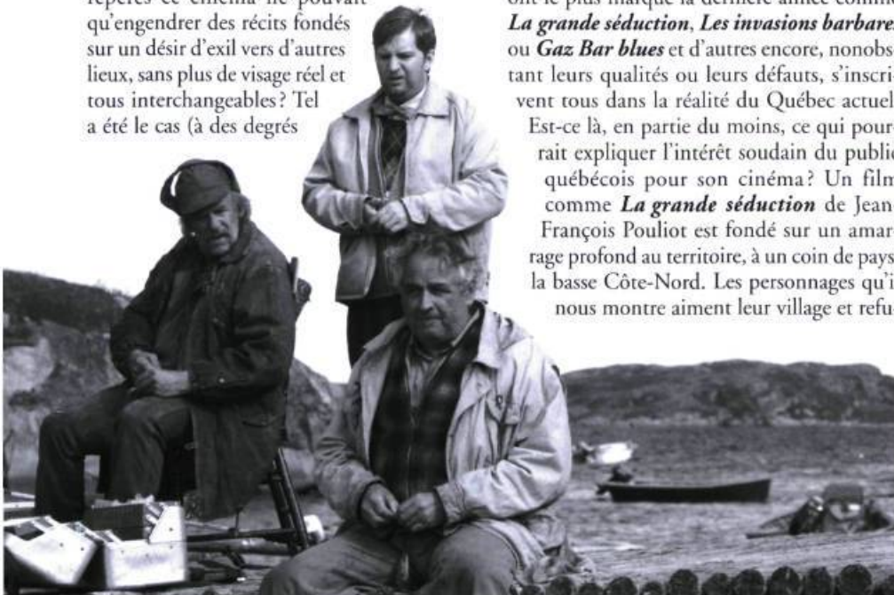
La grande séduction , un film fondé sur un amarrage profond au territoire.

Certainement il y a un peu plus d'humanité dans ce film que dans les autres d'Arcand, sans doute liée à une peur bien réelle de la vieillesse, de la maladie et de la mort, qui donne lieu à quelques moments d'une sincère profondeur. Arcand est ici revenu sur terre, aux côtés des êtres auxquels il donne vie et pour lesquels il manifeste, pour la première fois peut-être, une véritable tendresse. Malgré leurs travers, malgré leurs lâchetés, le cinéaste semble les aimer – bien que cette affection ne déborde jamais la limite du cercle des proches de Rémy. Si du coup Arcand