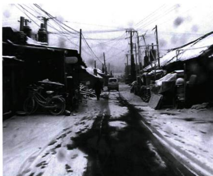
À l'ouest des rails de Wang Bing, voyage hallucinant dans un lieu à l'agonie.