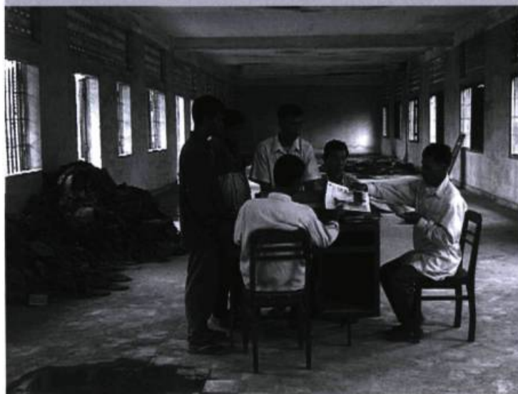
Cali : Cinématique québécoise

France, 2002. Ré. : Rithy Panh. Ph. : Prum Mésar, Rithy Panh. Mont. : Marie-Christine Rougerie, Isabelle Roudy. Mus. : Marc Marder. 101 minutes. Couleur.