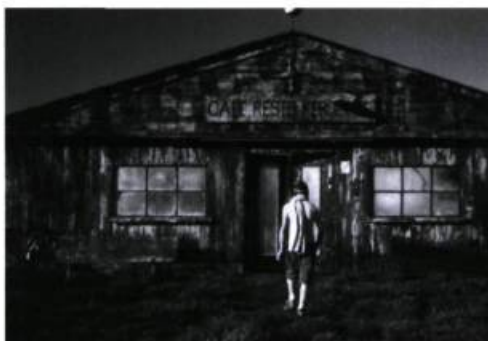
Pas de repos pour les braves d'Alain Guiraudie.