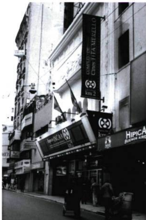
Espacio Tita-Merello/Km/2, le premier cinéma repris par l'INCAA, dans le quartier des cinémas en plein centre de Buenos Aires.

Grand centre de production cinématographique pendant les années 1930-1950, l'Argentine a une culture et une tradition cinématographiques. On y produisait des films sur une base industrielle, bien avant le Québec et le Canada. Toutefois, il faut noter que, contrairement à chez nous, l'INCAA 1 , même s'il revendiquait récemment son autonomie, ne s'est pas transformé en «partenaire» capitaliste de la production : il est plutôt devenu un protecteur officiel de la culture et du patrimoine national qu'est la création cinématographique.