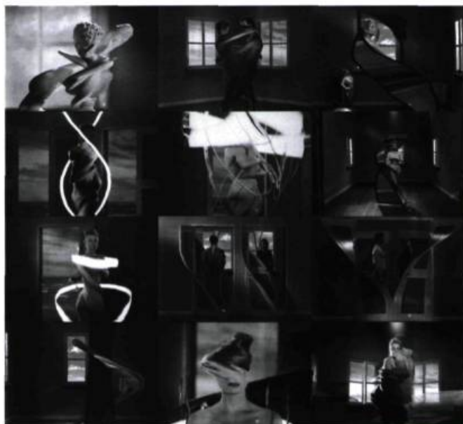
The Fourth Dimension de Zbigniew Rybczynski : l'art de concrétiser sa pensée et de toucher au surréel.

Rien ne sert cependant de verser dans les scénarios apocalyptiques face aux technosciences. L'immersion dans cette nouvelle culture est désormais notre lot commun et l'homme se doit d'apprendre à en maîtriser tous les aspects afin de maintenir l'intention créatrice au cœur des relations entre l'art et la technologie. Ce défi ouvre sur de nouveaux territoires à défricher et un sens à réinventer pour l'artiste. À cause de la nouvelle économie du numérique, le cinéma de création trouvera peut-être une partie de son salut dans les nouvelles caméras et les fenêtres de diffusion inédites qui commencent à se mettre en place. Mais c'est avant tout en opposant avec vigueur le principe de réalité à l'objectivation du monde et en affirmant sa puissance imaginaire que le septième