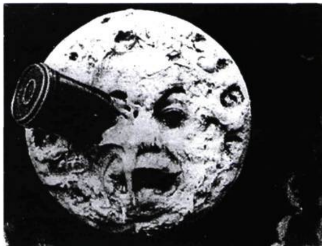
Le voyage dans la lune (1902) de Georges Méliès, l'illusionniste

Cependant, avec la simulation numérique et la « réalité augmentée » qui en résulte (voir l'hyperréalisme des effets spéciaux), l'image cinématographique subit une blessure narcissique et voit sa vérité ontologique subvertie. Alors que l'image traditionnelle relève de l'enregistrement d'une trace matérielle (ancrage optique et chimique) et entretient une relation métaphorique avec le monde, l'image