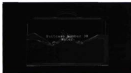
The Tulse Luper Suitcases de Peter Greenaway

À l'inquiétude que peuvent susciter ces nouvelles images, on répondra à l'instar d'Alain Renaud-Alain qu'en matière d'art, « l'histoire montre que l'on a rarement affaire à un remplacement pur et simple, mais à un déplacement », tant des codes esthétiques que sociaux. La photographie n'a pas été « la servante de la peinture », comme le prédisait Baudelaire et, avec l'émergence du cubisme, la peinture n'est pas morte, même si « elle remettait en question la perspective et l'hégémonie de l'œil » (Couchot et Hillaire). Elle s'est alors plutôt libérée de l'obsession réaliste et, couplée aux mathématiques, elle a retrouvé une autonomie esthétique et offert des propositions inédites dont on sait aujourd'hui le prix inestimable. De même pour la musique