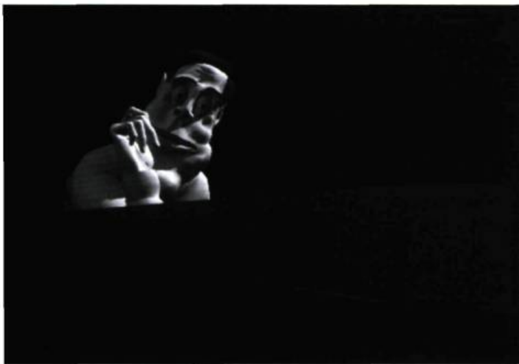
© Copyright 1985 Pierre Lachapelle. Photo: Gracieuseté de la Fondation Daniel Langlois

Tony de Peltrie (1985) de Pierre Lachapelle, Philippe Bergeron, Pierre Robidoux, Daniel Langlois