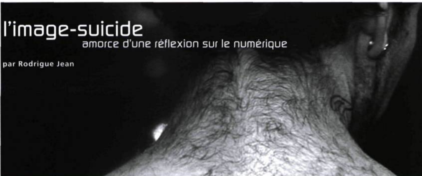
Image tirée du dernier film de Rodrigue Jean actuellement en préparation (tourné avec une caméra Sony HVRZIU Pal).

On nous avait annoncé la révolution numérique « avec fanfares et trompettes ». Prise de vues, montage et distribution allaient bientôt être réunis, en continuité, sous un même format. On connaît la suite : les cinémas ne sont pas équipés pour ce type de projection, trop onéreuse, et les menaces de piratage empêcheraient la distribution de films par satellite. Il est bon de rappeler que la technologie numérique (avec laquelle on est familier à toutes les étapes de production du son depuis les années 1990) n'a été appliquée à l'image qu'à la faveur d'un seul genre : le cinéma de science-fiction américain 1 . Cette technologie, liée à une restructuration économique des médias américains en quelques grands oligopoles, est étrangère à une cinématographie financée par de petits États.