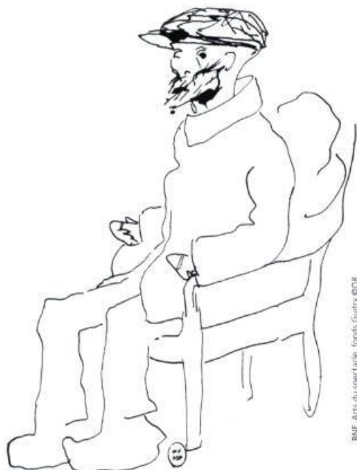
Sacha Guitry, portrait d'Auguste Renoir

Tout cela pourrait apparaître très franco-français s'il n'y avait la liberté avec laquelle Guitry s'empare des outils du cinéma, passant allègrement du récit en voix hors champ, à la mise en scène des personnages de l'Histoire. Il incarne lui-même, outre l'instituteur, deux de ses ascendants, Ludovic et Jean-Louis, Louis XV et Napoléon III. Il saute du présent au passé, dilate ou accélère le temps à sa guise, insère des images d'archives. Pour figurer une rapide succession de gouvernements, il fait défiler les ministres éphémères comme des pantins qu'un tapis roulant éjecte promptement. Guitry s'amuse et nous sommes au spectacle. Il n'est sans doute pas anodin que les prétendus ancêtres de l'instituteur furent ceux qui créèrent le guignol des Champs-Élysées.