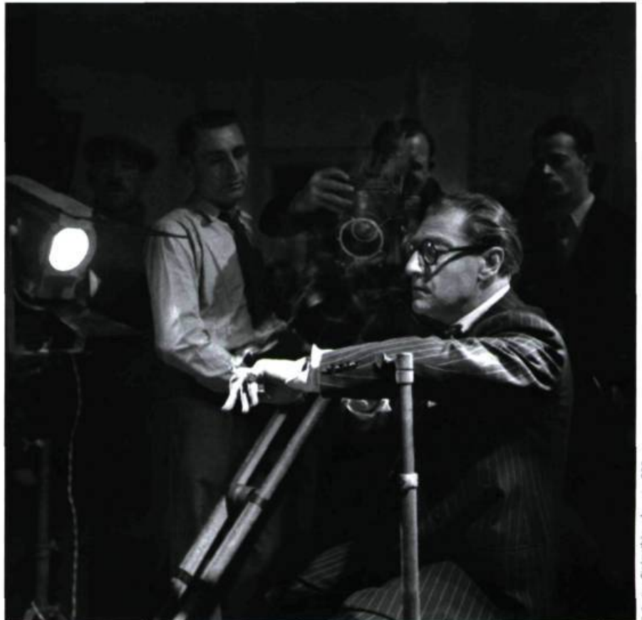
Sacha Guitry sur le plateau de son film Quadrille , studios de Joinville, 1937

Admirateur des génies, conteur fasciné par l'Histoire, inventeur de formes, moraliste, Guitry était aussi un magicien du verbe. Ses bons mots que la mémoire collective colporte ne sont pas toujours les plus subtils. On voudrait tous les citer, mais, même si l'auteur s'est prêté au jeu en publiant certains comme des recueils de maximes, il n'est pas certain qu'on leur rende ainsi justice tant cette verve qui semble intarissable vaut surtout dans la profusion de son jaillissement et dans l'allant avec lequel Guitry et ses partenaires s'en emparent. Une grande part de la force du théâtre de Guitry tient en effet à sa présence et à sa mise en scène.