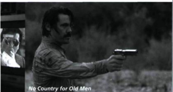
No Country for Old Men