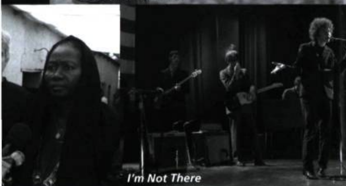
I'm Not There