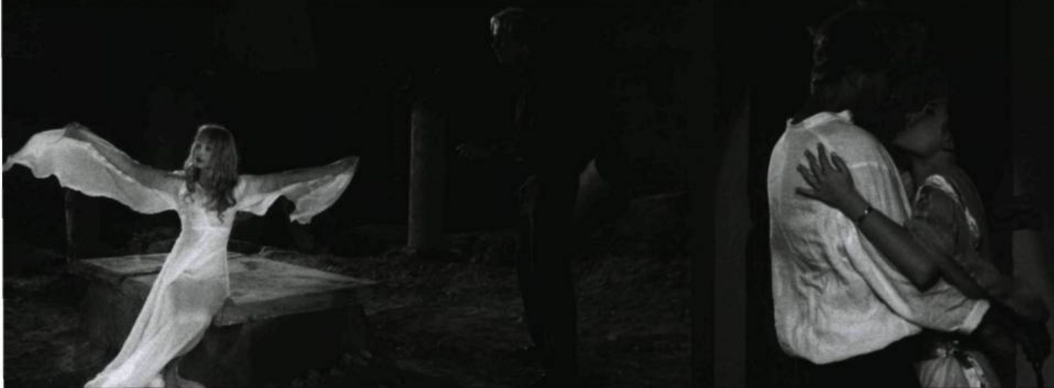
C'est Graduva qui vous appelle (2006)

La nouvelle de sa mort a été reçue un peu comme le furent la plupart de ses œuvres : on a salué l'originalité de sa démarche, la force de sa personnalité, sa contribution au débat sur l'évolution des formes esthétiques, mais certains ont aussi souligné le caractère dérangeant des fantasmes sexuels qui ont caractérisé ses dernières œuvres. En somme, son départ a été commenté avec respect, mais sans taire l'agacement qu'il n'a pas manqué de susciter tout au long de sa vie littéraire, surtout depuis son élection à l'Académie française où il a néanmoins refusé de siéger, au grand dam de cette institution. Et il a peu été question de son cinéma.