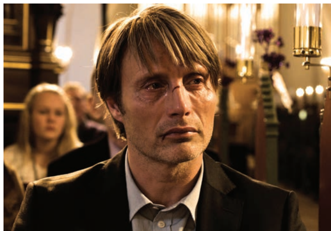
La chasse de Thomas Vinterberg

en Arkansas, grâce au jeu nuancé de Matthew McConaughey qui sauve la mise avec son personnage romantique d'amoureux et d'homme traqué en quête de pardon et de la figure des deux jeunes garçons eux aussi en mal d'amour. Mais on reste dubitatif sur la lecture que l'on peut faire de ce film gentil. Par contre, même si Nicole Kidman vient à sa rescousse, ce même Matthew