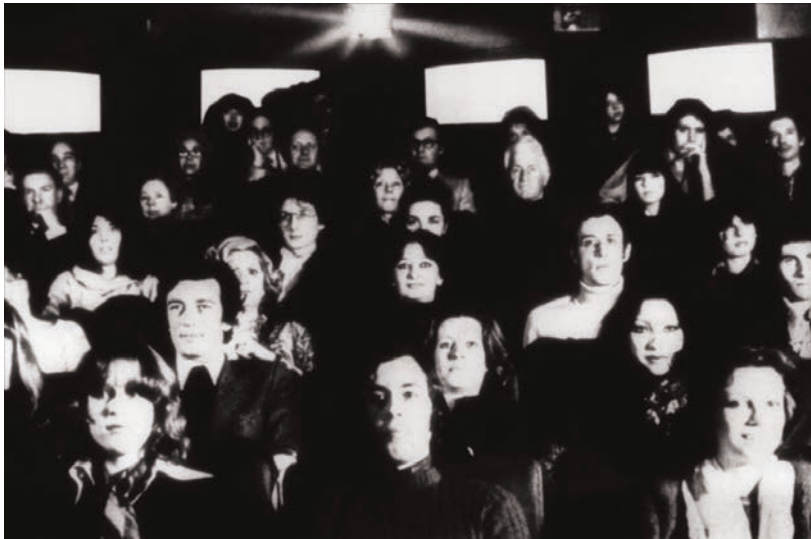
IN GIRUM IMUS NOCTE ET CONSUMIMUR.IGNI (1978) de Guy Debord

Tout transparent, tout est ouvert et tout est infini, entre ceux qui consomment intensément. Georges Bataille