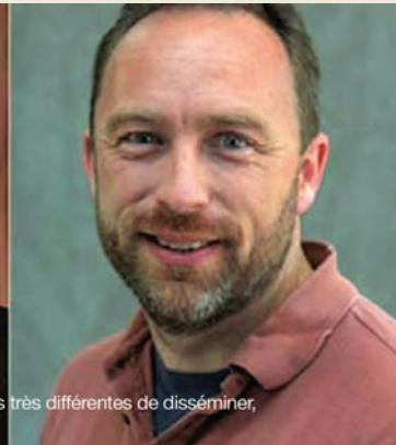
deux sourires et deux volontés très différentes de disséminer,