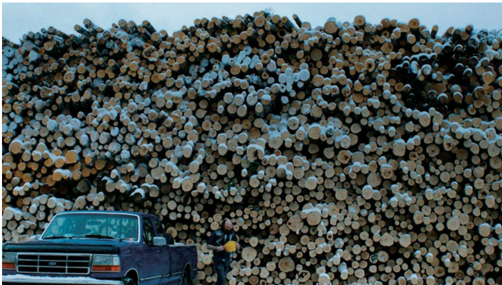
Bleu tonnerre (2015)