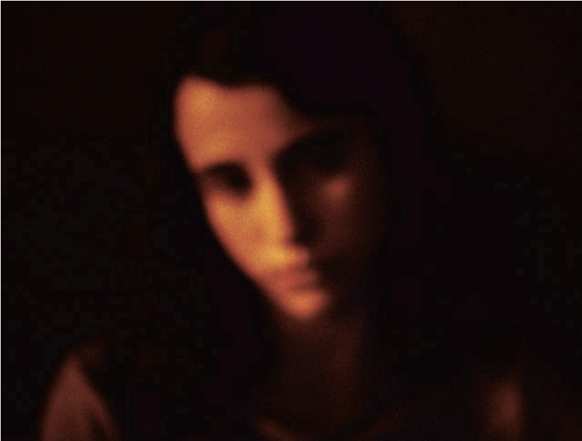
Tout simplement (2016)