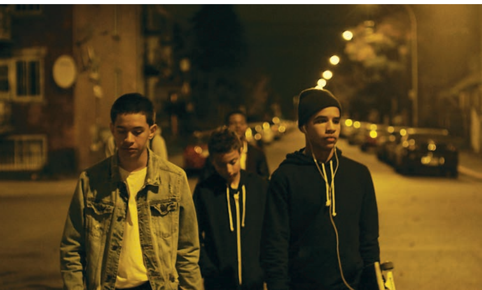
Ruby pleine de marde (2016) et Star (2015)

David, un conte urbain qui a été présenté à la Licorne en 2013 et qui est composé d'une série de courtes scènes autour de l'esprit de Noël. Je suivais la carrière de Sébastien et ce texte-là m'a particulièrement marqué. C'est la première fois que j'adaptais un texte, donc le processus était différent de ce à quoi j'étais habitué. Ça m'a permis d'être moins complexé à l'étape de l'écriture et d'aller plus loin dans la recherche visuelle.