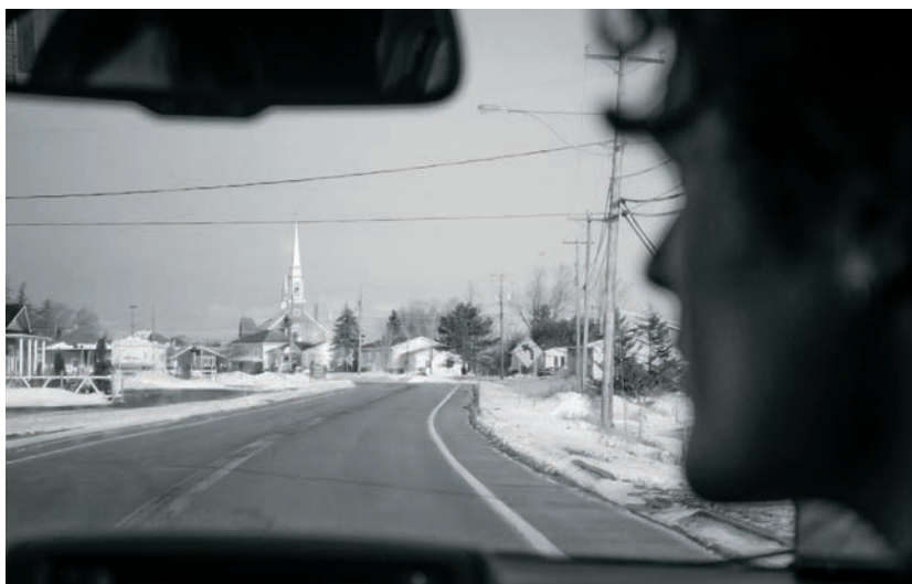
Elle pis son char (2015)

Raphaël Ouellet : De mon côté, j'ai choisi la photo. Le cinéma est un peu une erreur de parcours qui m'a plu. Je tourne pour des raisons qui me paraissent un peu égoïstes. Je tourne pour moi.