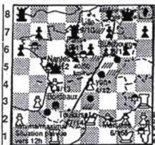
("Situation prévue vers 12 h.")