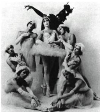
Les Ballets de Trockadero de Monte Carlo. Tutu... et travesti.

Spectacle d'humour et de féroce ironie où les plus beaux gestes sont doubles: on les fait et on en rit. On ne nous amène pas au pays des fées / on en revient plutôt. Very clever. From New York of course. Et la danse poursuit intelligemment son œuvre profanatrice tout en restant très digne: on ne se moque pas du ballet mais bien de ce qu'on en a fait. Un spectacle