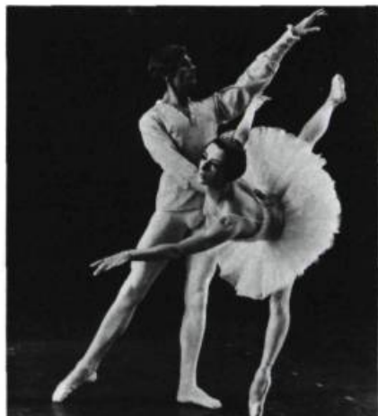
The Royal Winnipeg Ballet.

Spectacle d'humour et de féroce ironie où les plus beaux gestes sont doubles: on les fait et on en rit. On ne nous amène pas au pays des fées / on en revient plutôt. Very clever. From New York of course. Et la danse poursuit intelligemment son œuvre profanatrice tout en restant très digne: on ne se moque pas du ballet mais bien de ce qu'on en a fait. Un spectacle