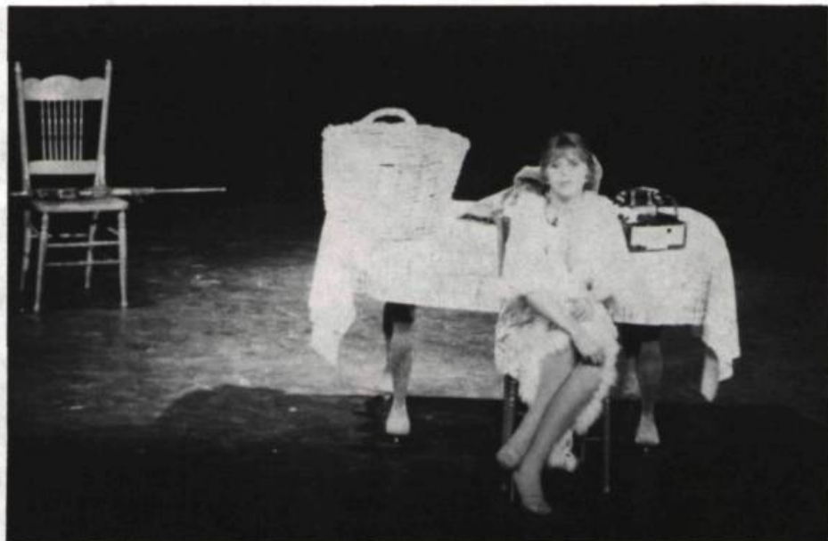
Franca Rame, dans In tutta casa, letto e chiesa , lors du 15 e Festival de l'A.Q.J.T., en mai 1983.