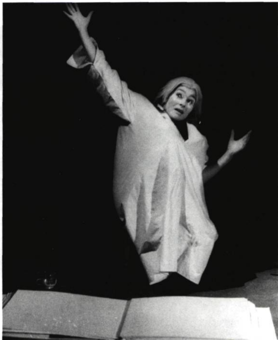
De la pose à la pause. Edith Clever dans Gross und Klein , mise en scène de Peter Stein. Photo tirée de Théâtre en Europe , no 1, p. 54.