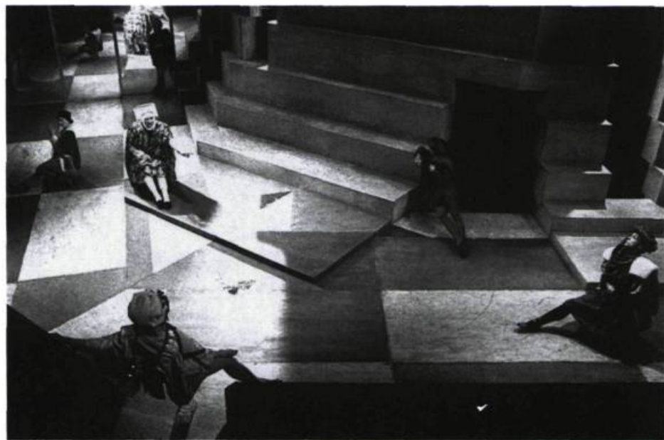
Se rapprochant de la scène élisabéthaine tout en la renouvelant, le plateau du Cycle des Rois était borné, sur les côtés, par de grands miroirs, et au fond, par un dispositif où étaient distribués paliers et ouvertures.

Au cours de la représentation, la scène était régulièrement traversée en diagonale par de fulgurantes apparitions des personnages, alors que d'autres, en même temps, obliquaient de bas en haut, grim pant aux praticables verticaux; tout cela, en un impressionnant ballet. Quand vinrent les batailles, on eut ainsi l'impression d'être envahi par de fortes armées,