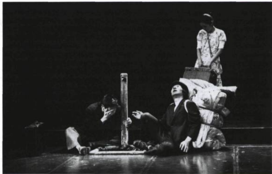
Water Station , du Théâtre Tenkei Gekijo. «Au centre d'une scène grise, un robinet ne cesse de couler, il coule comme la vie. [...] Toutes les femmes qui défilent souffrent, tous les hommes ou presque portent des bagages.»

Le rapport à la mort latente, dans lequel le théâtre japonais classique et contemporain excelle, ici ne nous atteint pas, à part quelques rares exceptions portées par une ou deux actrices, tous les artistes de cette troupe simulent sans que le tableau ne respire ni ne vibre à aucun moment. Seraient-ce donc mes seuls critères d'authenticité? Nullement: un psychologisme anecdotique serait tout aussi mortel. D'où vient alors ce sentiment de faux étouffant, cet insupportable parfum de complaisance? D'un redoublement du mensonge de