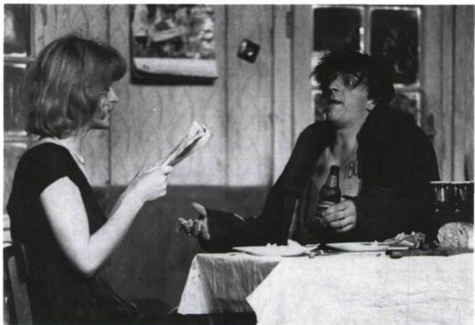
Une «fresque de la vie ordinaire et la tristesse d'un couple dans une Yougoslavie socialiste»: Tattoo Theatre , du groupe Open Stage Obala.

langage verbal, une pantomime intimiste: la petite histoire d'un homme et d'une femme de la classe ouvrière avec, en filigrane, une accumulation de bouteilles de bière, l'enfant qu'ils auront, et un lapin de la taille d'un être humain, source résurgente, surréaliste, qu'il faut décoder comme ce tatouage sans image que laisse la nostalgie de l'innocence amoureuse.