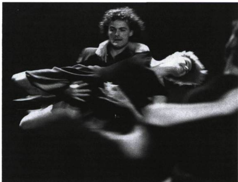
«Les corps s'empoignent — substitution exacerbée de la parole —, danses effrénées: une fête qui dérape sur du bard rock .» Needcompany «ne raconte rien sinon un procédé de déconstruction du spectacle en train de se faire».

La fresque de la vie ordinaire et la tristesse d'un couple dans une Yougoslavie socialiste. De la musique, une gestuelle excluant tout