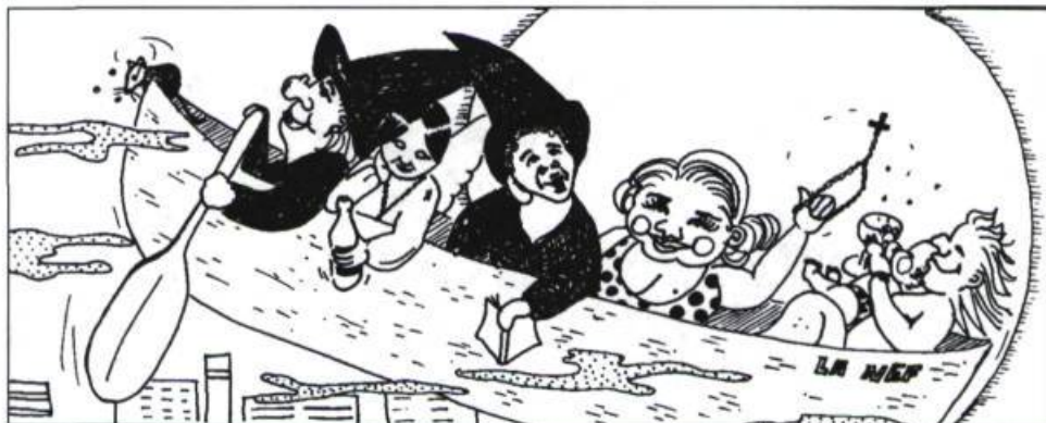
Dessin : Mathilde Havel.