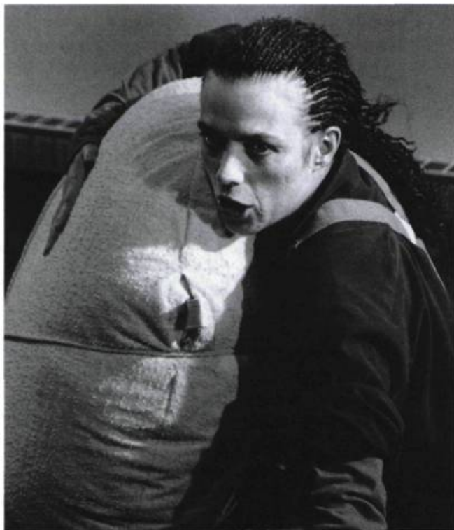
Joie (Théâtre d'Aujourd'hui, 1992).