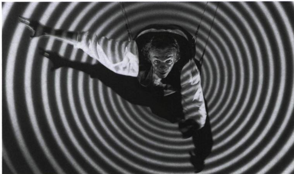
Marc Labrèche dans les Aiguilles et l'Opium . Représentation à Stockholm, en septembre 1994, lors de la tournée européenne.

Il y a d'abord ce physique protéiforme, pouvant incarner le pur et le corrompu, l'adolescent ou le vieillard ; capable d'exécuter de manière aussi convaincante le vol de l'ange, les contorsions du monstre ou les gestes inquiétants du maniaque ; il y a cette voix qui contient à elle seule bien des instruments de musique et qui aborde le texte classique avec autant d'assurance que la langue-de-bois-vermoulu de Reynald Paré, le petit gérant de caisse à l'accent pincé et tordu qui, tout en cherchant désespérément l'amour chez Pôpa et Môman, brûle les planches dans la Petite Vie . Marc Labrèche possède en plus un talent de caricaturiste et un humour dans le genre pince-sans-rire très subtil, qui ne gâtent rien. L'auguste et le clown blanc sont ses frères : du premier, il arbore l'innocence et la vulnérabilité ; du second, la sagacité et l'autorité. Il y a enfin ce visage tragique ou tendre, mobile, toujours expressif. En d'autres termes, tout ce qu'il faut pour s'attaquer à une reprise des Aiguilles... , un spectacle qui, dans sa trajectoire internationale, a récolté toutes sortes de récompenses — dont un succès qui ne semble pas près de s'essouffler auprès du public n'est pas la moindre.