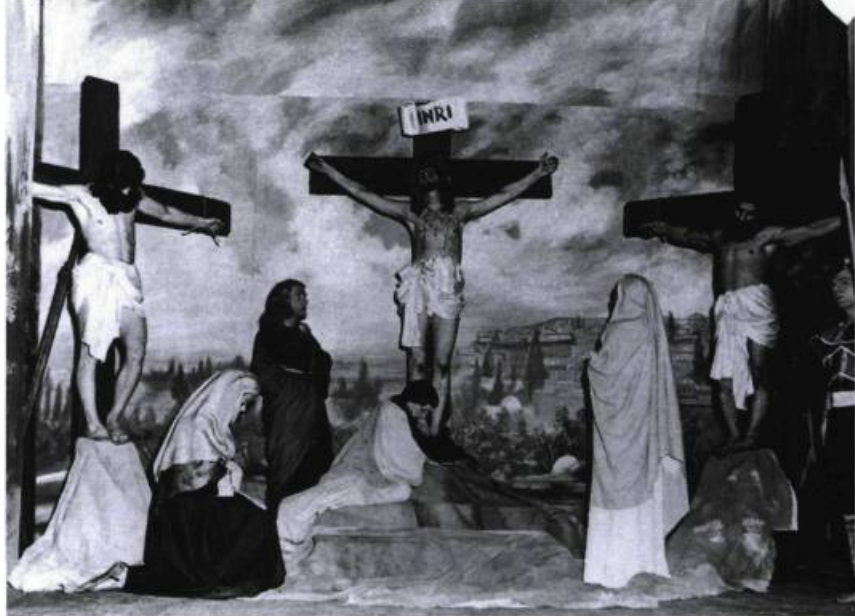
La Passion, Théâtre Canadien, 1945-1946.

concerne au premier chef le théâtre, qui étymologiquement signifie « donner à voir 4 » des personnages, des situations et des lieux qui sont mis en représentation. Ce « caractère reproductif de l'art théâtral », rappelle Pavis, explique que « le théâtre a souvent été considéré depuis Aristote comme une imitation directe de la réalité 5 ». Évidence, ici encore ? Plutôt un « malentendu 6 » tenace qui repose sur un certain mépris de la mise en scène que dénoncera avec vigueur Artaud, mais auquel Antoine, Stanislawski et Brecht donneront une crédibilité nouvelle au XX e siècle.