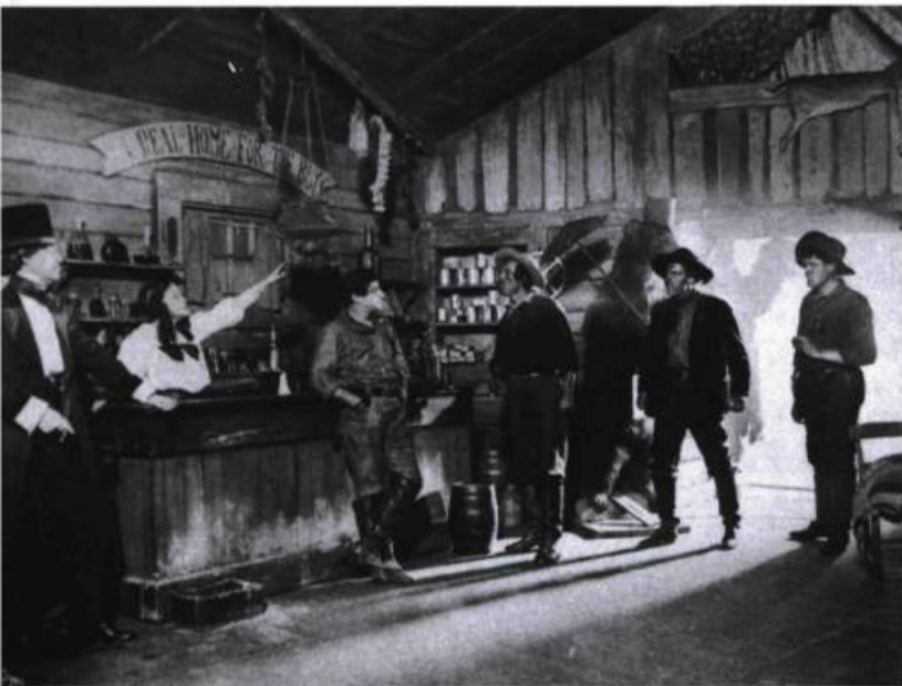
L'influence américaine : The Girl in the Golden West , production new-yorkaise présentée à Montréal, au Princess Theatre, en 1911.

Il est bon, parfois, de (se) rappeler certaines évidences. Ainsi, si le réalisme a souvent mauvaise presse, il a surtout bon dos, et c'est en son nom qu'à peu près toutes les révolutions esthétiques 1 se sont produites. « L'ambition du réalisme est donc légitime, car elle est profondément liée à l'aventure artistique », écrivait Camus 2 . Erich Auerbach l'a démontré de façon définitive dans son Mimesis , en suivant l'évolution du réalisme depuis ces récits fondateurs de l'humanité que sont la Bible et les épopées homériques jusqu'à un roman de Virginia Woolf, qui lui suggère de courts développements sur Proust et Joyce. La littérature ne s'éloignera guère de ces deux pôles initialement définis – théocentrique et vertical dans la Bible , anthropocentrique et horizontal chez Homère –, mais la manière changera avec les époques : c'est de mimésis, c'est-à-dire de la représentation de la réalité qu'il s'agit toujours, non du réel lui-même. Celui-ci ne peut toujours être posé que comme point de tension, comme ambition ultime jamais entièrement satisfaite : « Le seul artiste réaliste serait Dieu, s'il existe », écrit fort justement Camus 3 .