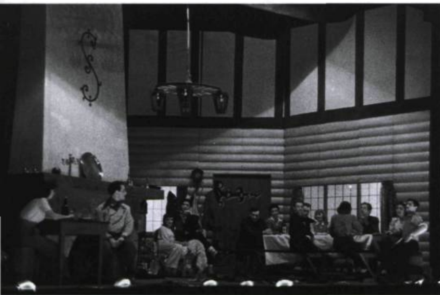
Altitude 3200 , premier spectacle mis en scène par Pierre Dagenais avec l'Équipe, en 1943.

Ceci explique probablement, pour une bonne part, les déboires de Julien Daoust dès la création du Théâtre National : on lui préférera Cazeneuve, qui saura servir même les mélodrames de Pixérécourt à la mode américaine. Cela dit, il faut garder la juste perspective des choses : les impressionnants mécanismes inventés à New York et par-