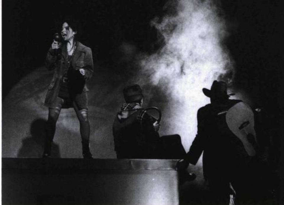
Thanatos, Théâtre des Moutons Noirs (Québec).

de croire que les marionnettes ont une libido. Il n'est donc pas question d'élucider la complexe théorie freudienne sur la sexualité ou d'y apporter une réflexion quelconque, mais de s'en servir comme moteur du jeu et d'une histoire un peu juteuse. L'ambiance des cabarets autrichiens sert de toile de fond à cette biographie amoureuse d'un Freud tenté par le stupre.