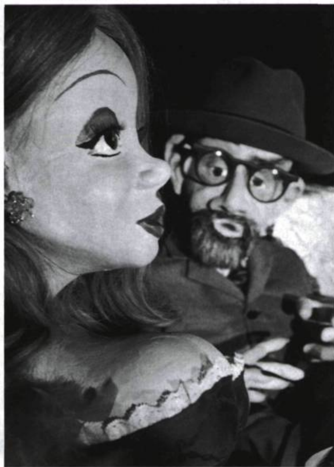
Les Enrobantes , Théâtre Pupulus Mordicus (Québec).

Freud est une des grandes figures pensantes de ce siècle, qui a nourri et les intellectuels et les clowns. Que le Théâtre Pupulus Mordicus, de Québec, ait voulu en faire une marionnette, au sens propre, n'est qu'un pas de plus pour faire connaître le psychanalyste et vulgariser la science qu'il a aidé à mettre au monde. Le sujet (si peu) audacieux abordé dans le spectacle les Enrobantes n'est nul autre que la sexualité, une des légendaires obsessions du barbu viennois. Les créateurs de « marionnettes pour adultes » (XXX !) se sont dit que le vrai Sigmund Freud n'était, lui, pas fait de bois et qu'il pourrait bien, comme tout le monde, manquer de mine dans le crayon. On a donc lancé le personnage à la recherche d'un remède contre l'impuissance. Ce qui fait sourire dans une telle pièce, c'est