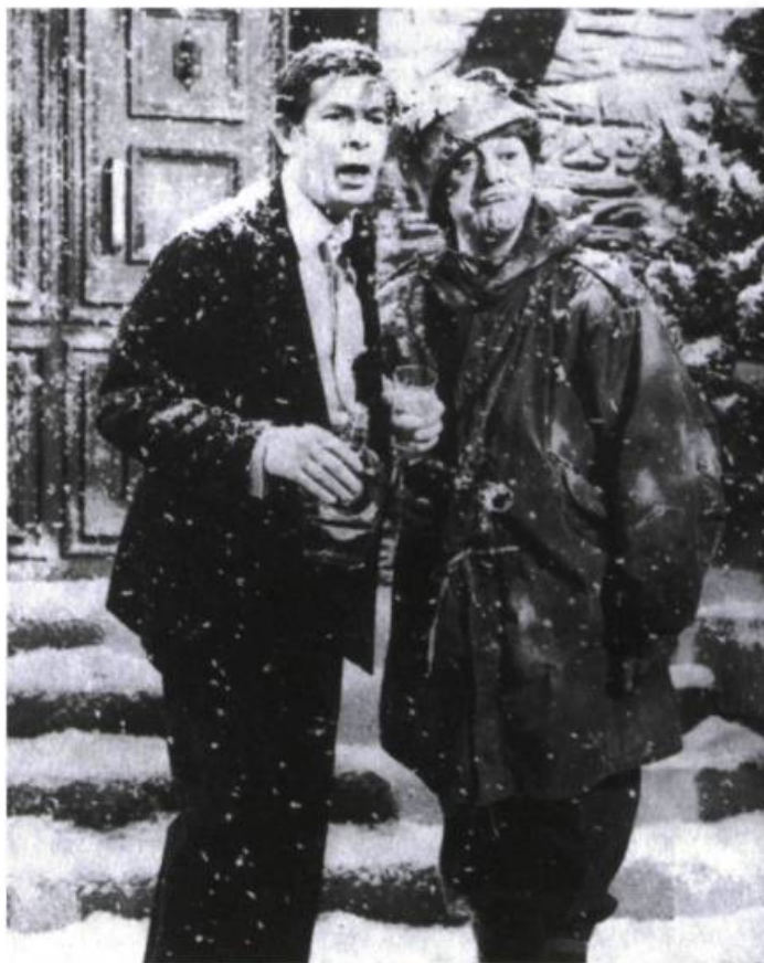
Denis Drouin et Olivier Guimond dans le célèbre sketch du Bye Bye 1970 à Radio-Canada.

par les micro-actions dont il est composé, met sous les yeux du spectateur le savoir-faire de l'acteur, mais dévoile aussi le gouffre – pathétique et comique – qui sépare les pauvres et les nantis, les francophones et les anglophones, les dominés et les dominants, « inventant » visuellement une proximité entre le bon diable ou le pauvre gars et le gentleman. Si Guimond met en place une gestuelle d'interaction dont l'ensemble donne l'image d'une grande liberté, d'une grande souplesse, ses partenaires de jeu soutiennent que tous ses mouvements étaient réglés comme un mouvement d'horlogerie. Serait-ce là le secret de sa présence ? Tension et élasticité du corps et de l'esprit. Une chose est sûre : c'est que par-delà l'enchaînement des micro-actions physiques réalisées par Guimond, se dégage de son comportement scénique, de son intelligence physique et du « langage énergétique » qui est le sien « une forme ( pattern ) d'énergie qui tantôt se dilate ou se rétrécit dans l'espace 17 », mais qui toujours rend vivante la présence de l'acteur comique dans un univers en folie. ■