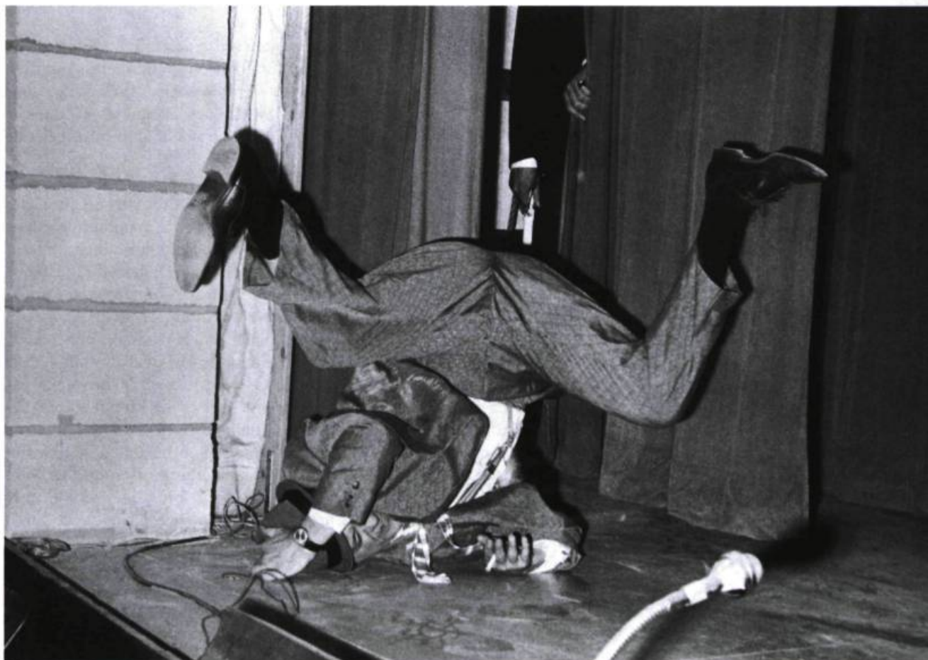
Olivier Guimond dans Trois Heures du matin et Billy Bevan dans A Small Town Idol de Mack Sennett (1921).

Cependant, sur le plan pratique, par son savoir-faire, Guimond ne vient-il pas inverser la théorie générale comique bergsonnienne ? Le jeu comique de l'acteur du burlesque n'est-il pas, en effet, moins « provoqué par du mécanique plaqué sur du vivant », selon la célèbre théorie, que par du vivant (le gag, le langage énergique) injecté dans la mécanique (l'ordre des choses, le déroulement de l'histoire) ? Et le jeu de l'acteur du burlesque, par sa débauche d'énergie et d'effets visuels venant submerger le scénario ou la trame du canevas, ne tient-il jamais que sur les marges faciles et comiques ? De cette exaltation visuelle et sonore ne peut-il pas sourdre une quelconque inquiétude ? Pour tenter de répondre à ces questions, revenons un moment à ces rôles d'ivrogne que Guimond fils a si souvent interprétés, afin d'en comprendre le secret. La clé, on s'en doute, ne tient pas dans le texte car, comme le souligne Gilles Latulippe, « [j]'ai déjà dit que j'écrivais pour Olivier Guimond ; c'est vite dit. On écrivait : Olivier entre dans la pièce avec un escabeau, trois rouleaux de tapisserie et un quarante onces [d'alcool], et on venait d'écrire vingt minutes 10 . » Moins de trois lignes de texte dans lesquelles Guimond trouvait les bases d'une partition qui se déployait dans l'espace.