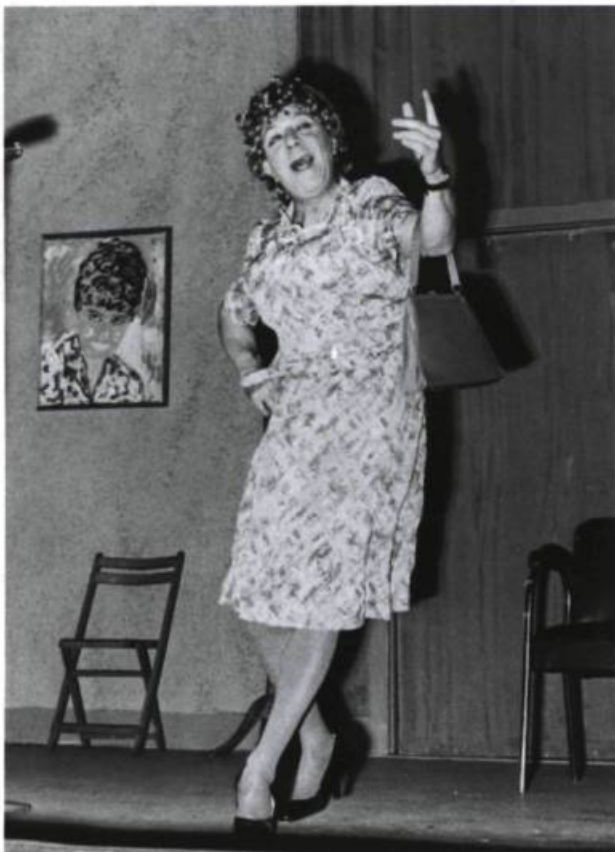
Équilibre et tension : Olivier Guimond fils dans Agence matrimoniale (Théâtre des Variétés, 1970.), entre Arlequin (gravure de Giuseppe Maria Mitelli, XVII e siècle) et Pantalón (eau-forte de Jacques Callot, 1616).

L'homme ivre ; une fois de plus, il s'adonne à une scène d'escalier. Après avoir hésité un court instant à l'invitation de Mr. Thompson, qui est sorti de chez lui quelque peu gris pour prendre une bouffée d'air frais et lui a offert un verre, Guimond cède à sa soif, à son penchant pour l'alcool. Après avoir accepté un verre, puis deux, porté un toast à la nouvelle année, un autre à Westmount, puis un autre encore à Saint-Henri, le caporal Olivier, éméché, ferme son walkie-talkie, coupe le contact avec son patron et enlève gentiment la bouteille des mains de Mr. Thompson. Parti d'un geste banal (boire un verre), l'acteur lui donne une impulsion nouvelle. La neige tombe, il sert