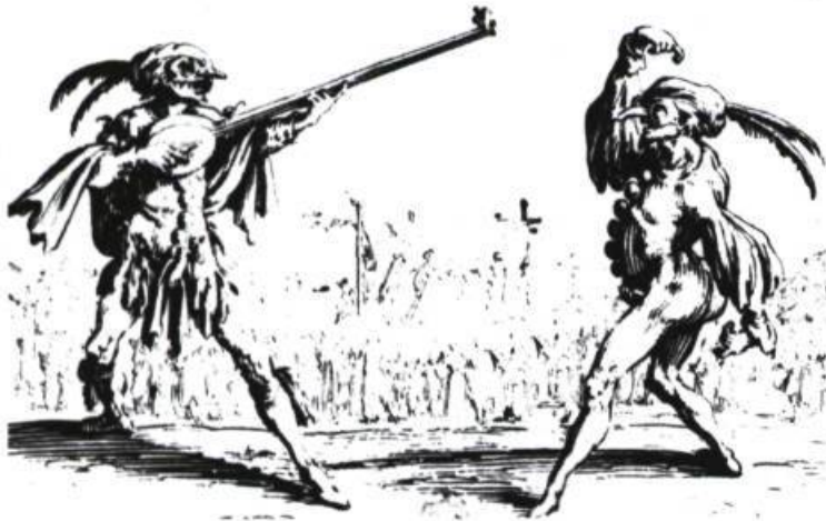
Razullo et Cucurucu, gravure de Jacques Callot. Paris, Bibliothèque nationale.

Quand le public est bon, là on le sent. Il va rire pour un rien. On travaille très très doucement. Mais quand le public est pas mal « gelé », là il faut travailler plus vite. Et puis moi je ne lâche pas. Il y a une manière de prendre son public 18 .