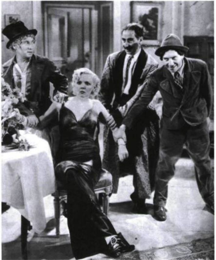
Les années 30 : les frères Marx dans A Day at the Races (1937).

Bien que cette théorie puisse combler en partie l'absence de principes dans la pratique actuelle, je pense qu'il serait important que les acteurs les plus représentatifs de l'art du geste comique nous communiquent leur réflexion et leur expérience sous forme d'écrits ou d'ateliers. Alors, peut-être, verrions-nous apparaître un jour une étude comparable à celle que Barba a entreprise sur les lois fondamentales du jeu de l'acteur, mais portant, cette fois-ci, sur des notions reliées à la gestuelle du comique. Cependant, avouons-le, l'aura de mystère et d'évanescence qui entoure le comique est une des conditions essentielles de sa manifestation. Bergson disait que, dans une société de pures intelligences, on ne pleurerait probablement plus, mais on rirait peut-être encore. On est toutefois en droit de se demander si l'intelligence parfaite de l'effet comique ne tuerait justement pas ce comique. Ce serait alors de la théorie plaquée sur du comique. j