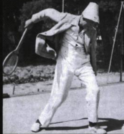
Stan Laurel et Oliver Hardy dans Our Relations (1936).