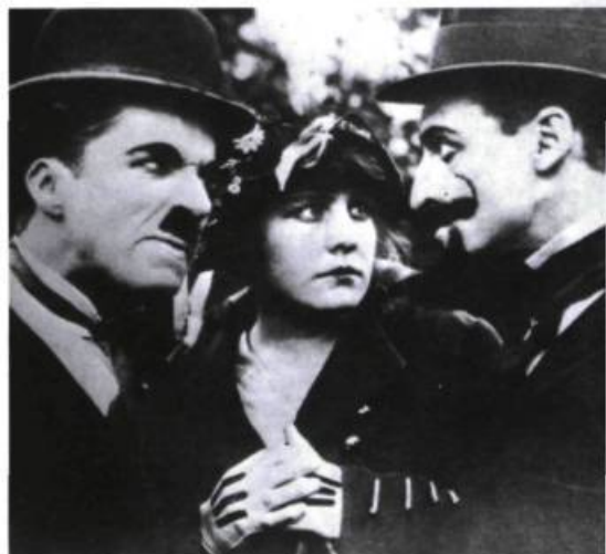
La mimique comique: Charlie Chaplin (avec Edna Purviance et Leo White) et Olivier Guimond (avec Denis Drouin).