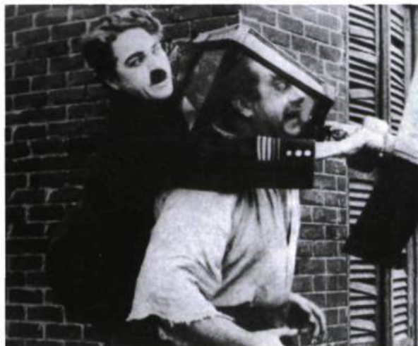
Le burlesque au cinéma. Les années 10 : Charlie Chaplin (avec Eric Campbell) dans Easy Street (1917).

La première constatation c'est qu'il ne suffit pas de raidir arbitrairement une partie de son corps, par exemple de courber le dos et de rentrer la tête entre les épaules, pour que le corps devienne risible 31 . Il faut aussi une certaine vie intérieure, un état chez l'interprète. Cet état peut prendre différentes formes : l'interprète peut ressentir du plaisir en donnant une forme particulière à son corps, sentir un rythme, une musique intérieure ou bien être habité par une émotion. Si l'exercice est fait sans