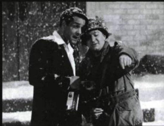
Louis de Funès et Bourvil dans le Corniaud (1965).