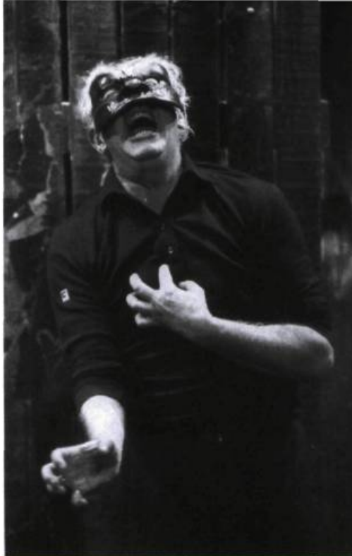
Dario Fo, un clown contemporain. Photo : Agence Bernard, tirée de Clowns et Farceurs , Paris, Bordas, 1982, p. 83.