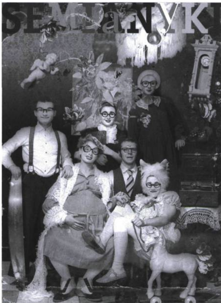
Semianyki du Théâtre Licedei (Russie), présenté au cégep André-Laurendeau en janvier 2007.

Joyeuse tribu d'hurluberlus, la famille de Semianyki ne dit pas un mot, mais le public comprend tout. Oui, le clown contemporain est le premier moteur du spectacle, mais la quincaillerie théâtrale y est utilisée de façon fort convaincante. Beaucoup d'effets comiques viennent de la bande sonore, avec des musiques, des effets spéciaux ou des bruits qui font parfois l'objet de scènes étonnantes. Le son d'une craie sur un tableau permet au fils de famille de gribouiller sur des murs imaginaires qu'on voit par sa gestuelle apparaître sur scène. Le spectacle est rythmé et poétique avec un humour à la fois absurde et très concret. Le tout avec un sens inconditionnel de la famille, et cette touche qu'on pourrait qualifier de slave, poétique et en même temps incisive. Bref, un très bon spectacle qui aurait mérité d'être vu par les élèves de l'École de cirque et tous les circassiens de la région de Montréal. ■